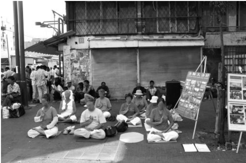
Figure 3 - Adeptes du Falun Dafa à Neve Sha'anana

sol 23 est en soi un exemple avéré de l'intensité et de la complexité des dynamiques qui animent les frontières sociales au sein de l'espace israélo-palestinien.