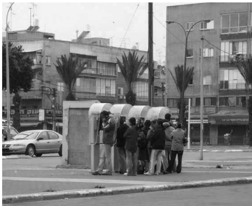
Figure 4 - Travailleurs asiatiques au sein de Neve Sha'anán