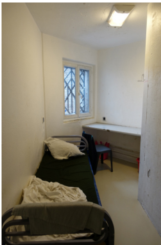
IMAGE 5. CELLULE EN MAISON D'ARRET

qui nous a rejoints lors de l'avant dernière cellule, fait également le lien entre les filles qui ne se respectent pas (notamment à travers leurs comportements sexuels