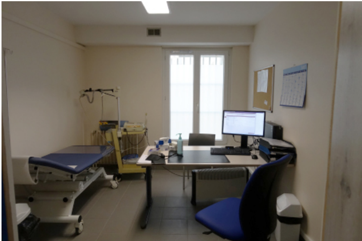
IMAGE 8. UNITE SANITAIRE, SALLE DE CONSULTATION