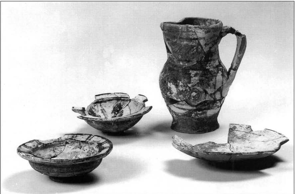
Figure 6 Majoliques à décor vert et brun