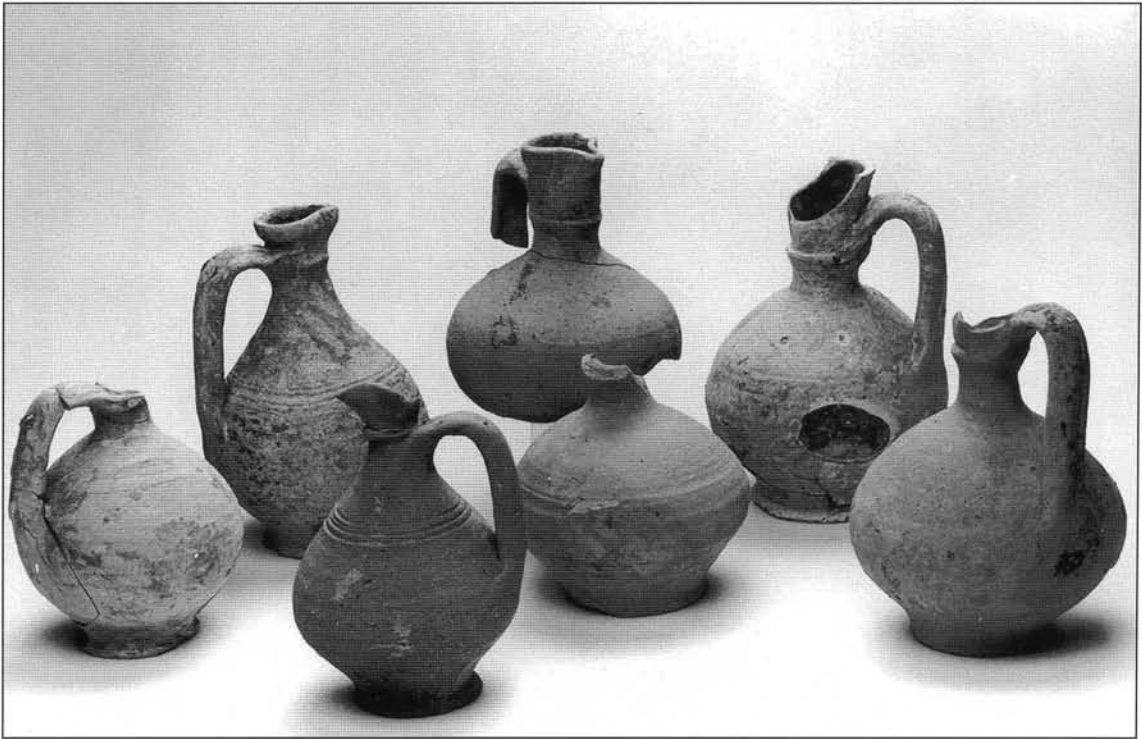
Figure 5 Pichets glaçurés