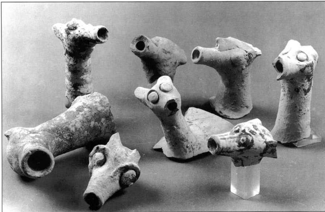
Figure 4 Becs tubulaires zoomorphes