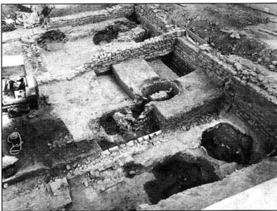
Figure 2 Vue du chantier en cours de fouille