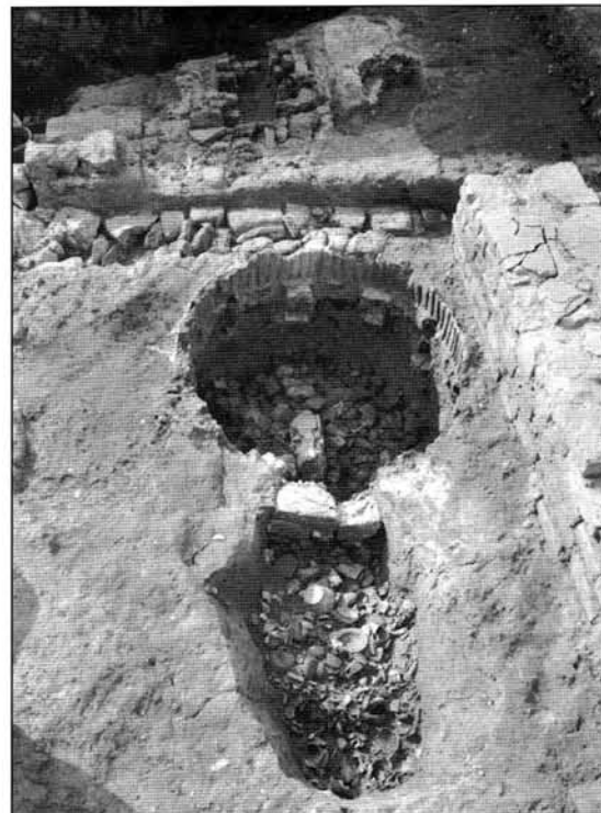
Figure 3 Vue du four S 107 et à l'arrière plan le four à oxyde S 110