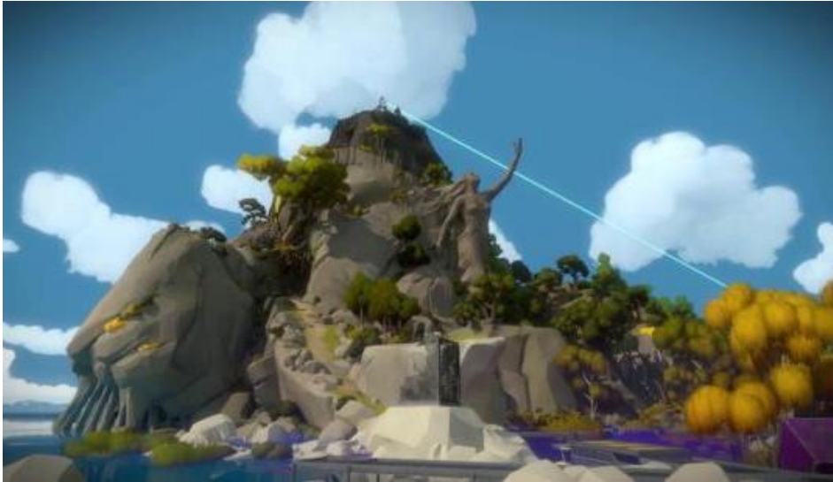
Figure 4. : Exemple de changement d'angle dans l'observation des statues de The Witness

Inciter à la réflexivité par les mécanismes ludiques