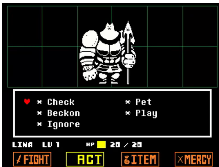
Figure 3. : Le combat contre Greater Dog 2