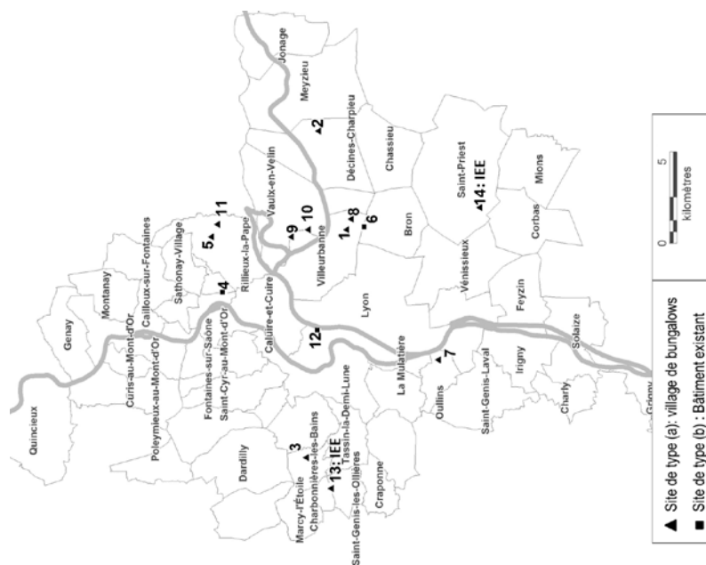
Figures 1 et 3 – Localisation des projets d'hébergement collectif pour familles étrangères dans l'agglomération lyonnaise et référencement selon la typologie du 1.2