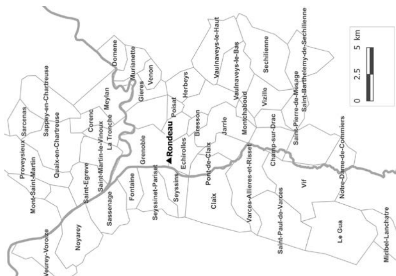
Figure 2 – Localisation du projet « Rondeau » à Grenoble

© IGN, enquête 2015-2016. Réalisé sous Map Info par L. Fontaine & P. Teppe.