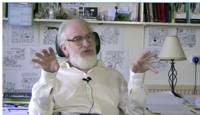
Figure 2. Quantification des noms massifs abstraits « THE WEIGHT of English usage » (David Crystal)