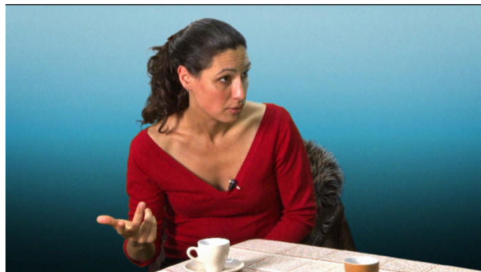
Figure 4. « PUISQUE tu l'aimes... » (Calbris et Montredon, 2011)

Dans sa recension des signifiants gestuels et des signifiés qui leur sont associables, Calbris (2011) identifie pourtant des « notions » ou « signifiés » qui concernent au premier chef la grammaire : l'antériorité, la postériorité, la successivité, la conséquence, le commencement, la continuation, la répétition, l'achèvement, la quantité, la totalité, le degré, l'égalité,