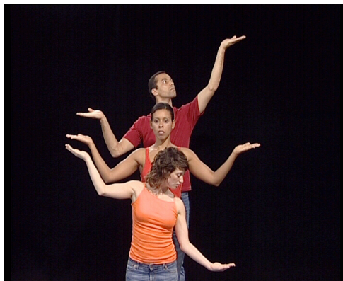
Figure 9 – Postures comparatives

L'espace dansé peut être rempli d'objets fictifs, qu'un regard ou qu'un geste suffisent à instituer 2 . Le sens peut ainsi être assimilé à une masse de substance invisible qu'on « saisit en bloc » dans la construction article zéro + indénombrable ( mass noun ) : \emptyset life , \emptyset beauty , \emptyset silence . Une expérience passée peut être traitée comme un objet (abstrait) qu'on recherche avec Have you ever met her? , qu'on ramène et qu'on exhibe manuellement dans le champ de la réalité présente avec Yes, I have . Des éléments qu'on compare avec as...as... , not as...as... et more / -er than... peuvent devenir des « choses » placées dans un état d'équilibre ou de déséquilibre dans l'espace qualitatif et quantitatif entourant le danseur-conceptualisateur.