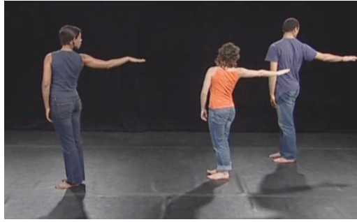
Figure 4 – Remonter le temps avec ago