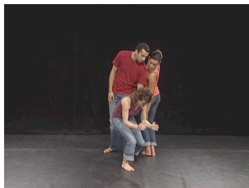
Figure 6 – Poser, postuler l'existence avec some

Nous étendons cette logique à l'étude de certains déterminants (ou actualisateurs du nom) comme some qui signale un parti pris d'existence : « la chose existe, on le sait, on la voit. »