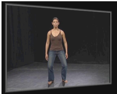
Figure 1 – Ancrage déictique dans l'ici-maintenant du présent

A partir de l'ancrage déictique fondateur constitué par le moi, l'ici et le maintenant du sujet parlant, le français et l'anglais distinguent un passé, un futur et un présent, conçus comme autant de zones temporelles, respectivement situées derrière soi, devant soi et sous ses propres pieds, à l'endroit même où on se tient. Dans le système de représentation gestuelle que nous proposons, la danseuse exécute un pas pour signaler son entrée dans l'espace de conceptualisation spatio-temporel et s'immobilise un instant pour s'inscrire physiquement dans l'ici du présent, légèrement en ouverture, repoussé: