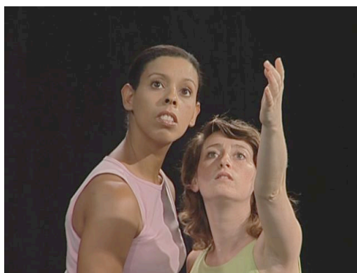
Figure 8 – Créer et explorer d'autres réalités avec if + will / would

Enfin, il est possible de tracer les espaces mentaux (Fauconnier 1984, Fauconnier & Turner 2002), correspondant à if + présent + will... ( If you listen carefully, you'll learn ) et if + prétérit modal + would ( If I had more money, I would live in San Francisco ). Dans le premier cas, on construit un espace fictif crédible devant soi, dans ce que nous appelons la zone proximale de réalité maximale (Lapaire 2006: 187). Puis on scrute cet espace et on l'investit manuellement pour « faire voir / montrer ce qui se passera quand on y sera ». La même gestualité est adoptée pour if + prétérit modal + would... , mais l'espace est situé plus haut, dans l'oblique pour signifier que la situation envisagée est en décrochage par rapport à la réalité (attestée ou concevable).