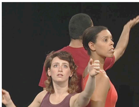
Figure 7 – Interroger l'existence avec any

Any , en revanche, ne pose rien, n'impose rien et semble plus tâtonnant (« la chose existe peut-être, on ne sait pas; on cherche, on se demande s'il y en a »). L'énergie du mouvement reflète ce changement. Le moindre degré de réalité s'accompagne d'une modification de l'axe, l'oblique étant plus apte à exprimer l'irréel que le perpendiculaire ou le frontal :