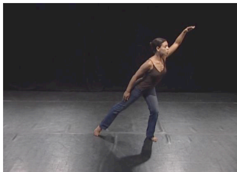
Figure 3 – Plongée vers le futur

La séquence s'achève par une inclinaison du buste suggérant la contemplation visuelle-mentale de « l'horizon futur », que l'observateur « scrute » en s'étirant vers lui, ou qu'il laisse « venir à lui », s'il attend que les « choses arrivent (d'elles-mêmes) ».