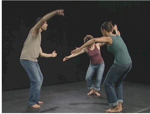
Figure 10 – Variation sur les indénumérables ( mass nouns )