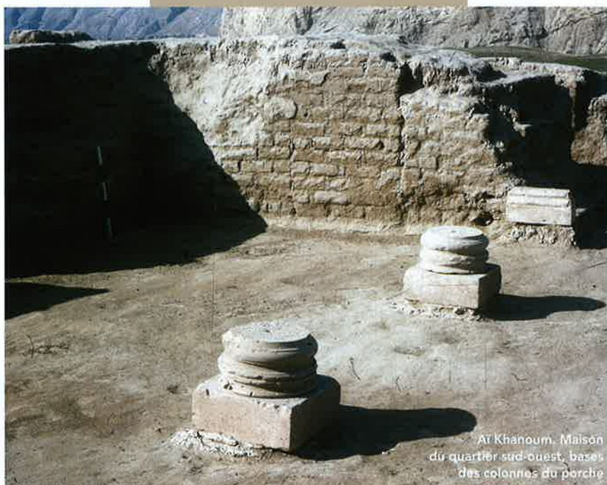
Aï Khanoum. Maison du quartier sud-ouest, bases des colonnes du porche