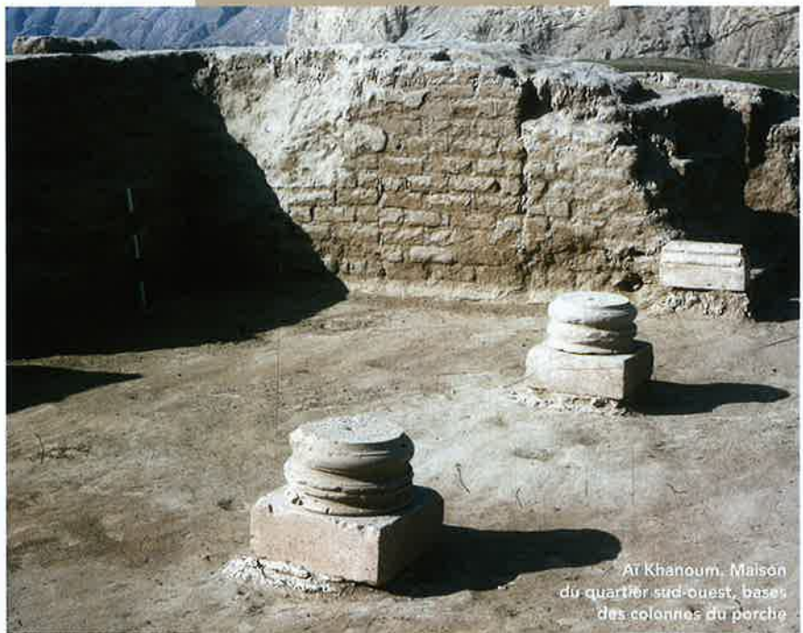
Aï Khanoum. Maison du quartier sud-ouest, bases des colonnes du porche