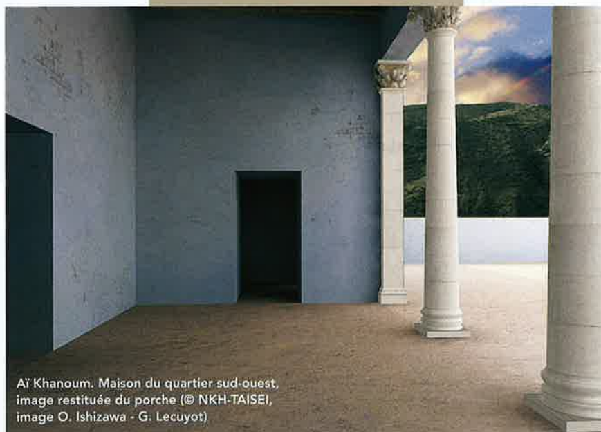
Aï Khanoum. Maison du quartier sud-ouest, image restituée du porche