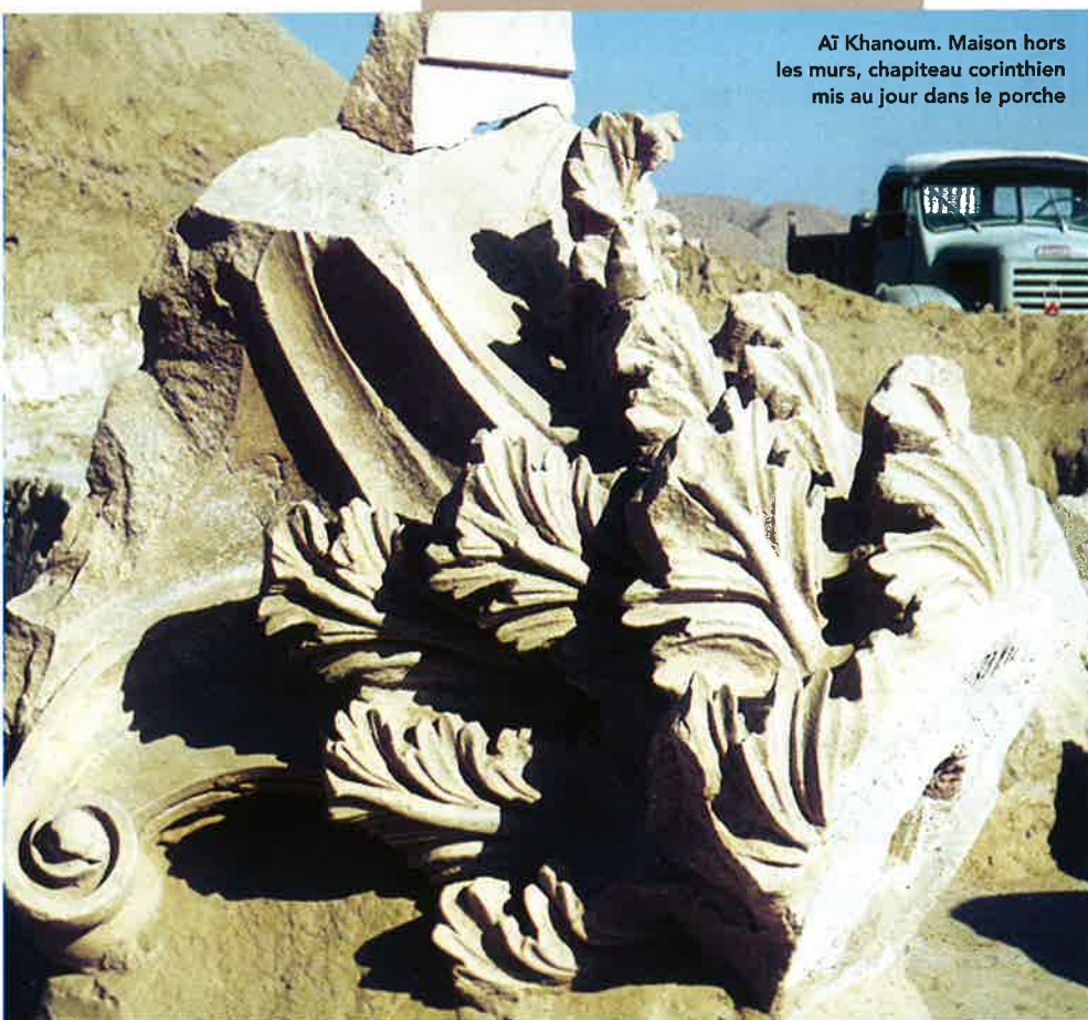
Aï Khanoum. Maison hors les murs, chapiteau corinthien mis au jour dans le porche

Le second élément structure et décore le porche situé entre le corps de logis et la cour. Il consiste en colonnes et antes en pierre ou en bois, pourvus de bases et de chapiteaux de type grec. Une rangée de tuiles et d'antéfixes vient le plus souvent orner la bordure des toits plats. La colonnade du porche de la maison hors les murs devait atteindre une hauteur de près de huit mètres d'après les vestiges qui y ont été mis au jour.