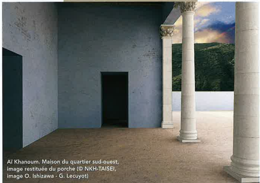
Aï Khanoum. Maison du quartier sud-ouest, image restituée du porche