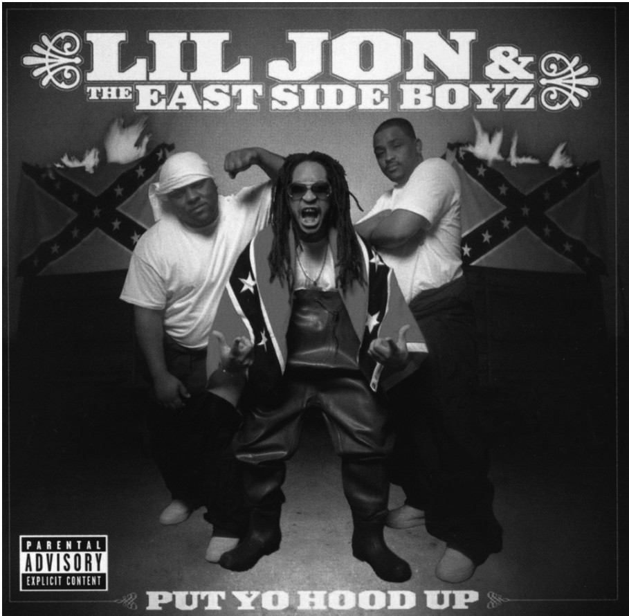
Fig. 1 : Pochette de l'album Put Yo Hood Up de Lil Jon and The Eastside Boyz (2001)

Géorgie, comme le montre le port d'une combinaison étanche associée aux activités de pêche.