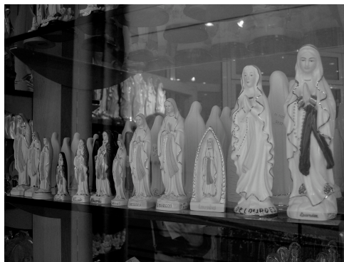
Fig. 1.