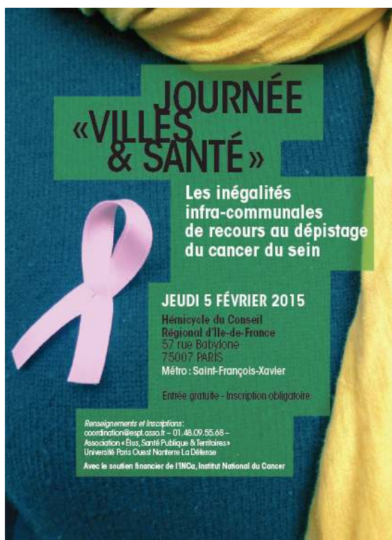
FIGURE 1. AFFICHE DE LA JOURNÉE DE RESTITUTION DES DIAGNOSTICS TERRITORIAUX DE SANTÉ PRODUITS EN 2015