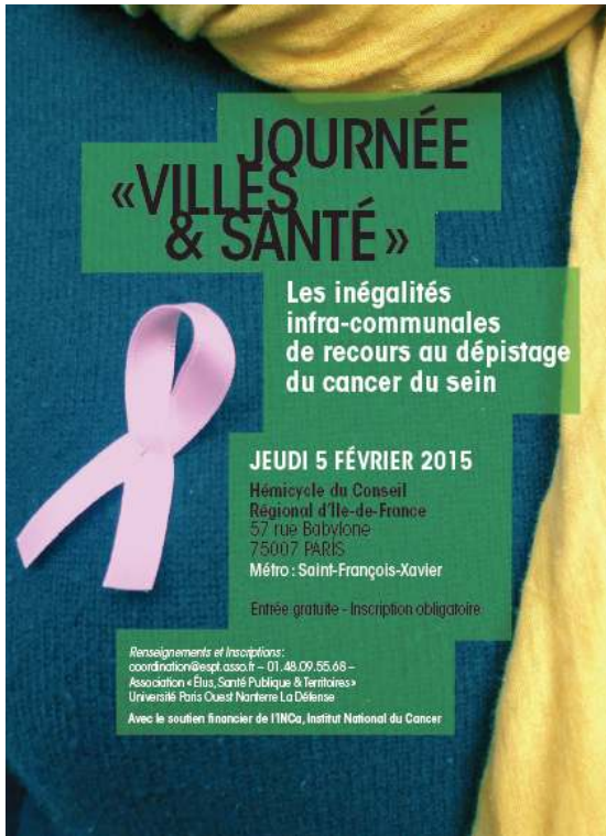
FIGURE 1. AFFICHE DE LA JOURNÉE DE RESTITUTION DES DIAGNOSTICS TERRITORIAUX DE SANTÉ PRODUITS EN 2015