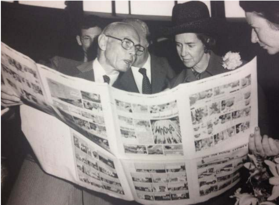
Ill. 2. La reine Fabiola découvre les pages de Vol 714 pour Sydney , en compagnie de Louis-Robert Casterman (1977).