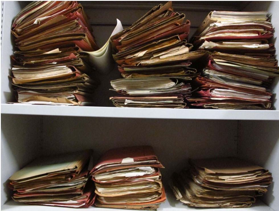
Ill. 3. Une (faible) partie des dossiers « auteurs ».

promettent également d'importantes trouvailles, rassemblant contrats d'édition, échanges de courriers, relevés de droits, demandes d'avances, récriminations sur la qualité d'une réimpression, projets avortés... De l'histoire sociale de la profession d'auteur de bande dessinée à celle de sa construction symbolique, une large gamme de pistes reste à parcourir – tout comme, du côté de l'album, les archives offrent des perspectives de premier ordre de par la place qu'occupe Casterman dans ce secteur (ill. 3).