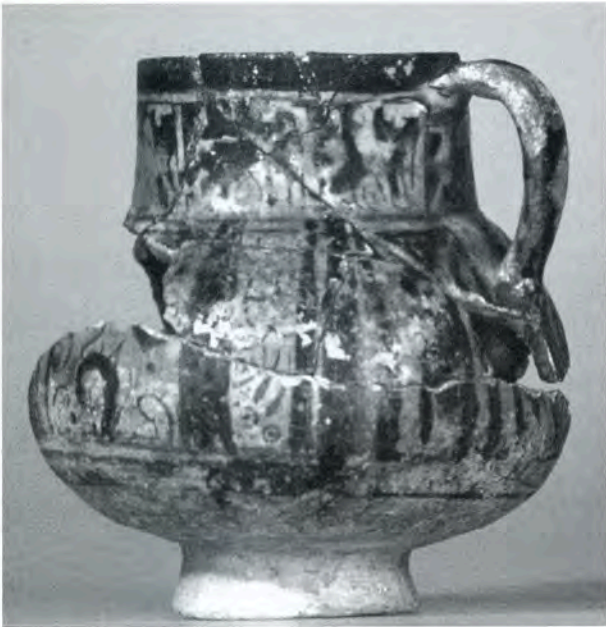
Fig. 5 - Pot à pâte siliceuse et décor bleu et lustre peint sous glaçure incolore. Narbonne XIV e siècle. Musée d'Art et d'Histoire de Narbonne).

logiques, d'autres mentions telles celles de terres dites de Bejaia (Bougie) demeurent encore énigmatiques. Elles concernent à n'en point douter des faïences venues d'Outre-Méditerranée, des articles de luxe qui trouvent leur place chez des apothicaires ou des particuliers toujours fortunés. Mais il n'est pas possible de mettre en regard une production de faïences qui dans l'appellation se distingue de celles d'Espagne ou d'Italie.