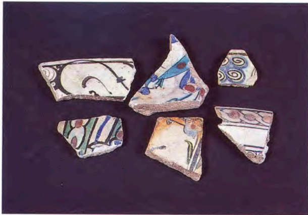
Fig. 8 - Faïences d'Iznik, Marseille, fin XVI e -XVII e siècle. (Service régional de l'Archéologie, PACA).

inventaires mobiliers de l'aristocratie et de la bourgeoisie régionale regorgent aux XVII e et XVIII e siècles, ne subsistent qu'un petit nombre de témoignages archéologiques issus du port de Quarantaine marseillais sur