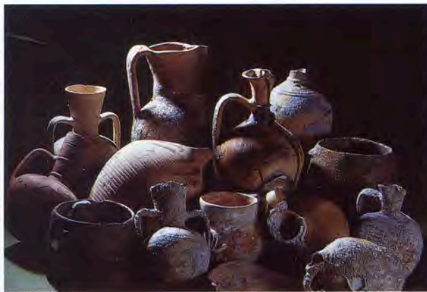
Fig. 1 - Jars et marmites de l'épave sarrasine du Batéguier x e siècle (Drassm, Cannes Musée de la Mer, Musée d'Histoire de Marseille).

Celles-ci apparemment contemporaines, au vu de la ressemblance confondante des céramiques, ont coulé pour trois d'entre elles le long de la côte d'Azur tandis que la quatrième s'est échouée au large de Marseille (fig. 1). Leur présence incongrue ne s'explique que si l'on imagine un contact de celles-ci avec la terre ferme. Or aucun indice matériel de la présence des Arabes n'a encore été retrouvé sur notre sol. La nature des chargements