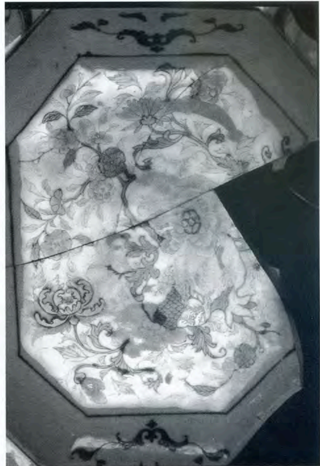
Fig. 7 - Le Prince de Conti (Belle-Ile) 1746. Plat en porcelaine de Chine à décor bleu et émaux colorés visibles par reflets. (Drassm). Cl. Y. Rigoir.

Parallèlement, d'exceptionnels arrivages de porcelaine ont lieu à Marseille au dire des textes à partir de 1289, puis, en contextes princiers tout au long du XV e