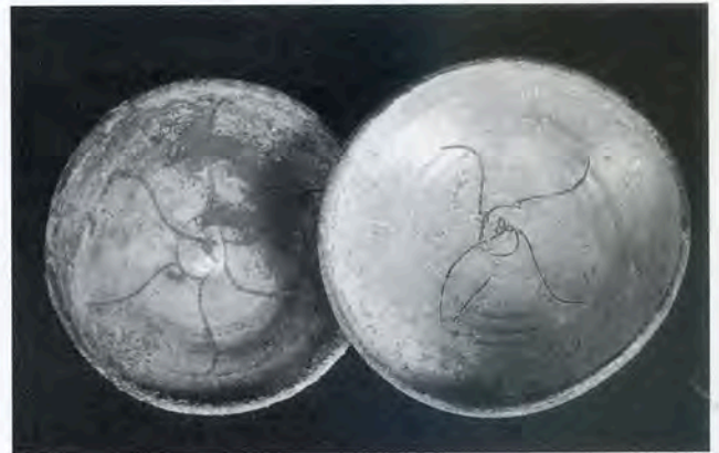
Fig. 4 - Épave de Castellorizo ? (Rhodes) XIII e siècle. Coupes glaçurées égéennes à décor incisé sur engobe. (Drassm). Cl. Y. Rigoir.

marseillais qui y ont un consul à partir de 1220 tout comme Ceuta et Alexandrie. Ces liens sont concrétisés par la création de foundouks destinés surtout aux cuirs et aux laines. L'autre point d'appui important dans les relations avec la Barbarie sont les Baléares reprises aux musulmans, mais Messine et Syracuse jouent un rôle analogue. De grosses jarres coulées en Corse du Sud, à Agde, Narbonne (fig. 2), en Catalogne et dans le port de Palerme illustrent ces échanges tandis que d'autres arrivées à bon port sont soigneusement conservées dans les maisons provençales.