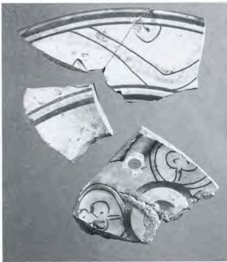
Fig. 3 - Coupelle à marli glaçurée à décor incisé sur engobe « Zeuxippus Ware » de l'aire byzantine, XIII e siècle, Hyères, Monastère de Saint-Pierre de l'Almanarre. (Service Régional de l'Archéologie, PACA).

suggère des bateaux de commerce vaquant à leurs trafics ou destinés à ravitailler une petite communauté qui pourrait correspondre à celle installée, selon la tradition historique, au Fraxinetum dans le golfe de Saint-Tropez. Il est tentant de rapprocher ces naufrages du