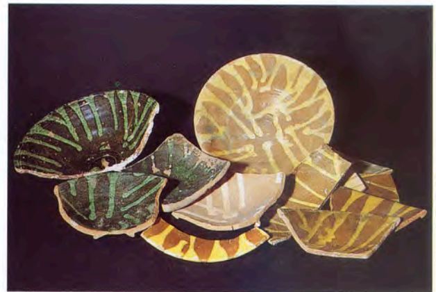
Figs. 10 et 11 - Coupes glaçurées à coulures d'engobes et engobes mêlés de Thrace. Marseille Pomègues, XVIII e siècle. (Musée d'Histoire de Marseille).

et 11) et des vases monochromes, sans doute de Thrace du Nord et de la région de Constantinople, ainsi que des assiettes engobées polychromes de Çannakale d'inspiration populaire, (fig. 12) et d'élégants vases à filtres syro-égyptiens tout simplement fonctionnels (fig. 13).