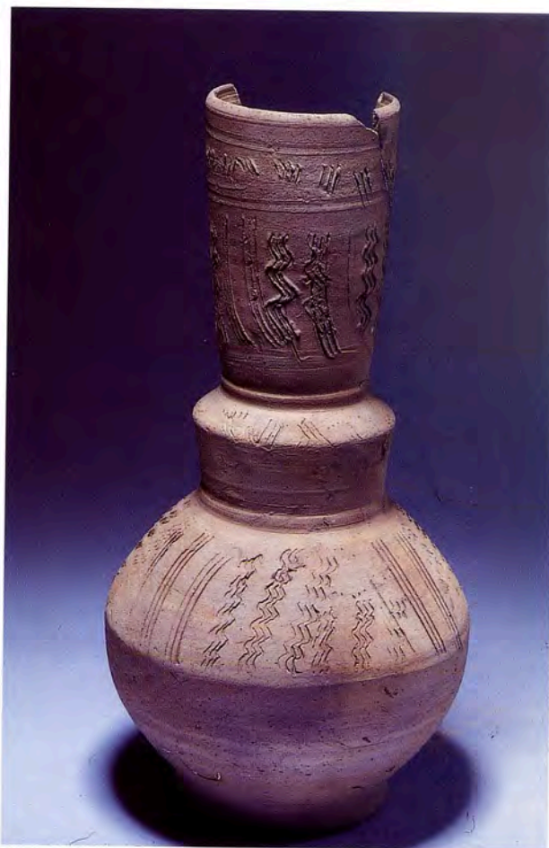
Fig. 15 - Gargoulettes à filtre à décor incisé. Marseille Pomègues, XVIII e siècle. (Musée d'Histoire de Marseille). Cl. C. Durand.

Amouric, Richez, Vallauri 1999 : Amouric (H.), Richez (F.), Vallauri (L.) - « Vingt mille pots sous les mers », le commerce de la céramique en Provence et Languedoc du X e au XIX e siècle . Musée d'Istres. Édisud, Aix-en-Provence 1999.