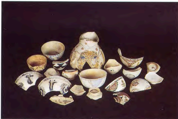
Fig. 9 - Pichet à anse et "Fingeau" en faïence polychrome de Kütahya. Roquefeuille, Pourrières, Var et Marseille Pomègues, XVIII e siècle (Service Régional de l'Archéologie, PACA et Musée d'Histoire de Marseille). Cl. Y. Rigoir.

inventaires mobiliers de l'aristocratie et de la bourgeoisie régionale regorgent aux XVII e et XVIII e siècles, ne subsistent qu'un petit nombre de témoignages archéologiques issus du port de Quarantaine marseillais sur