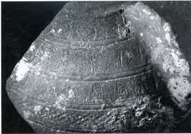
Fig. 2 - Narbonne XII-XIII e siècle. Jarre islamique à décor imprimé. (Musée de Fos-sur-Mer).

suggère des bateaux de commerce vaquant à leurs trafics ou destinés à ravitailler une petite communauté qui pourrait correspondre à celle installée, selon la tradition historique, au Fraxinetum dans le golfe de Saint-Tropez. Il est tentant de rapprocher ces naufrages du