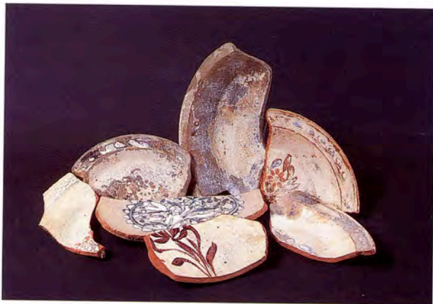
Fig. 12 - Coupes glaçurées à décor peint sur engobe. Marseille Pomègues, XVIII e siècle. (Musée d'Histoire de Marseille).

Byzantium, in the East, seems to have played only a minor role. The trade in wine amphora and slipware or incised Byzantine or Cypriot ware, as well as cooking vessels from Beirut was no doubt encouraged by the creation of the Crusader kingdoms in the 12th and 13th centuries. Siliceous vases from Syria and Chinese celadons bear witness to the distribution of these precious oriental wares reserved for princes and lords during the 14th and 15th centuries. Between the 16th and 19th centuries sporadic discoveries reveal an awakening to the world and to the exotic. Whether from China, Japan or the Ottoman countries, whether porcelain, Iznik or Kütahya ware, or vessels from Çannakale or Thrace, all passed through Marseilles, the queen of Levantine trade.