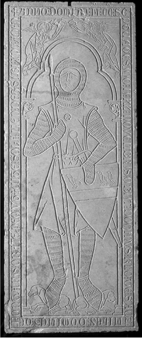
Illustration 1 : Plate-tombe de Calon de Saulx, 1270, Musée archéologique de Dijon (Côte d’Or).

Tirage-à-part adressé à l'auteur pour un usage strictement personnel. © Librairie Droz S.A.