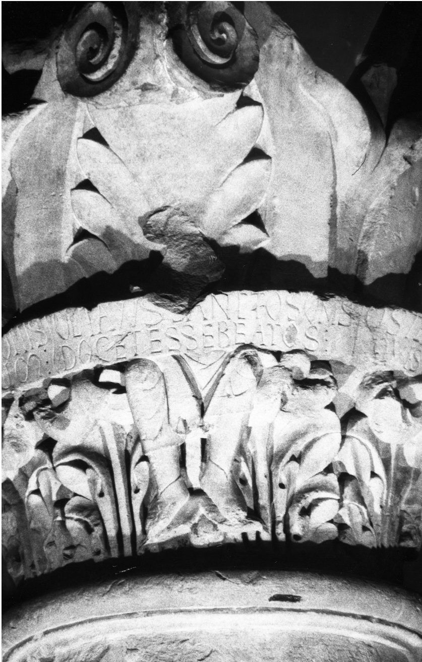
Illustration 4 : Chapiteau du plain-chant, début XII e s., église abbatiale de Cluny (Saône-et-Loire).