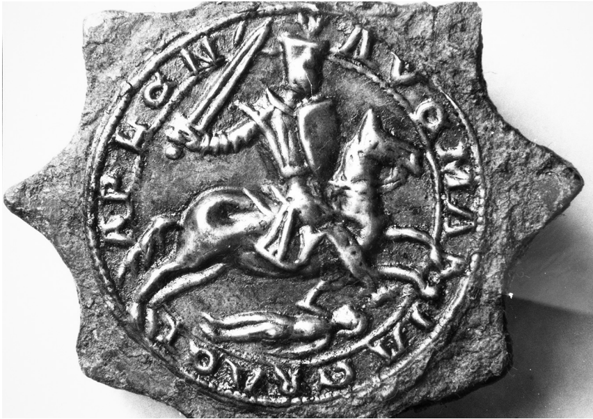
Illustration 6 : Poignée d'une dague, XIII e s., Musée Denon à Chalon-sur-Saône (Saône-et-Loire).