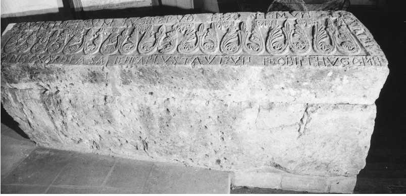
Illustration 2 : Tombeau du chevalier Hugues de Troarn, milieu XII e s., église Sainte-Croix de Troarn (Calvados).