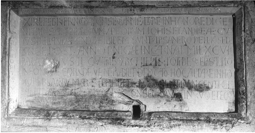
Illustration 5 : Inscription de consécration de l'autel matutinal, 1096, église Saint-Jean de Montierneuf de Poitiers (Vienne).