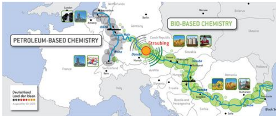
Figure 1. Le positionnement stratégique du port de Straubing