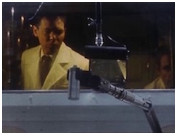
Images 14 et 15. Scènes associant chercheur et technicien dans le travail Extraits du feuilleton Les Atomistes

Le monde des subordonnés est un monde de prudence ensuite : vis-à-vis des curiosités extérieures toujours soupçonnées d'être menaçantes, que ce soit face à un projet de vulgarisation, face à la disparition de documents ou face à la crainte d'une intrusion dans le centre.