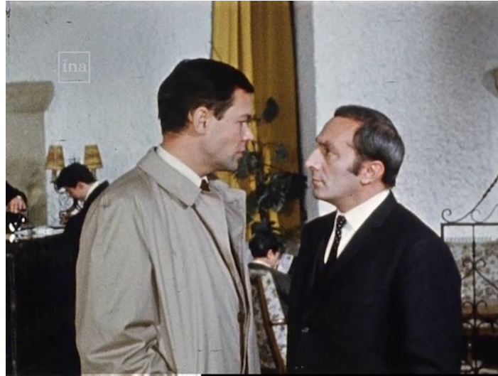
Image 22. Scène de dispute entre le chef des chercheurs et le frère d'un technicien accidenté Extrait du feuilleton Les Atomistes

- Le frère : Pour moi, qu'est-ce que ça change ? Qu'il meure de ça ou d'autre chose, quelle différence ? Votre raisonnement est monstrueux ! » (épisode 20, de 4'02 à 5'16)