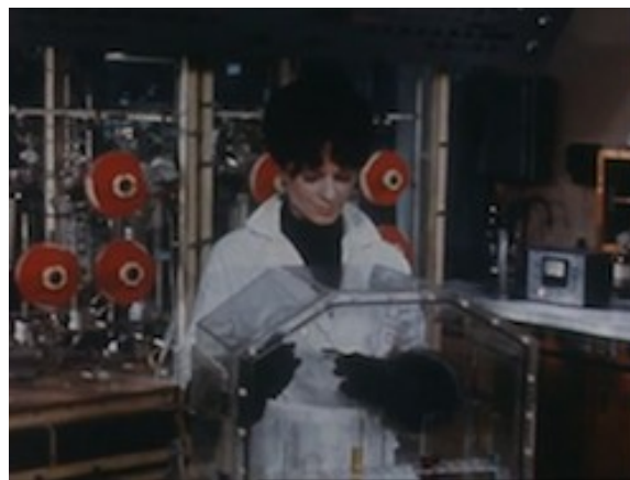
Images 8 et 9. Images du travail sur le centre nucléaire Extraits du feuilleton Les Atomistes

L'univers de travail offre aussi divers points d'appui pour construire des énigmes qui sont indispensables pour soutenir l'attention du spectateur quand on veut écarter comme trop futiles les répertoires de la romance ou de la passade entre collègues de travail, qu'utilisent abondamment les scénaristes et réalisateur des Chevaliers du ciel dans le même type d'univers technique. C'est a minima un univers qui se prête bien à la formulation de défis et de péripéties, avec des expériences premières en forme d'échecs avant des succès. Ainsi, durant la première semaine du feuilleton, va-t-on se demander si le chercheur arrivera à constituer l'équipe qu'il veut, avec quasiment un épisode dédié à convaincre chacun des quatre personnages qu'il veut entraîner. Ce thème de l'équipe sur lequel s'applique particulièrement bien la séquence défi-difficulté-revirement ne vaut