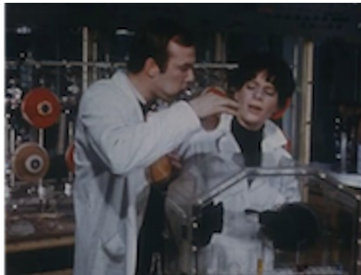
Image 13. Scène irréaliste de travail Extrait du feuilleton Les Atomistes

pourrait avoir sur les doigts. Ailleurs, la chimiste sort d'une intervention de maintenance dans une salle blindée et quitte sa tenue de protection et son masque sans précaution alors qu'ils sont susceptibles de porter de la contamination qu'il faut prendre soin de ne pas remettre en suspension dans l'air ni d'inhaler au déshabillage. Les besoins de la narration romanesque autorisent ce type de liberté qui ne semble pas gêner les autorités du CEA qui suivent la réalisation du film.