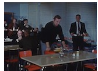
Images 2 à 7. Images du travail et de la vie sur le centre nucléaire Extraits du feuilleton Les Atomistes

Si l'on s'accorde à considérer que le projet de télévision-vérité a besoin, chez le spectateur, d'une connaissance première du monde décrit pour produire son effet d'information-distraction, se joue ici la fabrication de cette connaissance première sur un univers jusque-là objet de fantasmes, dans