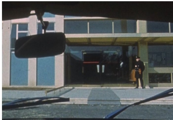
Image 21. Garde armé à l'entrée du réacteur Rapsodie de Cadarache, servant d'image extérieure au bâtiment de travail des chercheurs du feuilleton Extrait du feuilleton Les Atomistes