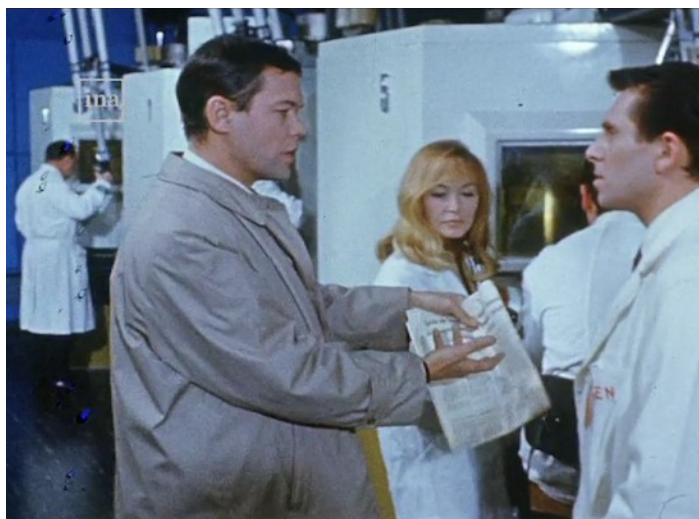
Image 12. Figurants du monde nucléaire au second plan Extrait du feuilleton Les Atomistes

secteur mais sans doute aussi du service d'exploitation des installations fréquentées, qui veille à ce qu'il n'arrive aucun accident aux membres de l'équipe de tournage 15 . Un comédien se rappelle qu'on lui disait comment se comporter au travail, qu'il n'avait qu'à refaire les gestes qu'un agent lui avait montrés et que cet agent jouait son propre rôle dès que la caméra se concentrait sur ses mains ou ses épaules. Les figurants issus du monde nucléaire sont nombreux sur les plans tournés dans les installations 16 . Le réalisateur évoque à ce propos les limitations de son autonomie qu'il ressentait à tout instant sur les tournages dans les installations nucléaires, sans pouvoir distinguer aujourd'hui ce qui tenait à la protection de l'équipe contre tout risque d'accident, ce qui tenait à ce qu'il ne fallait pas risquer de laisser voir à des puissances étrangères et ce qui tenait au souci de promouvoir une image flatteuse du secteur.