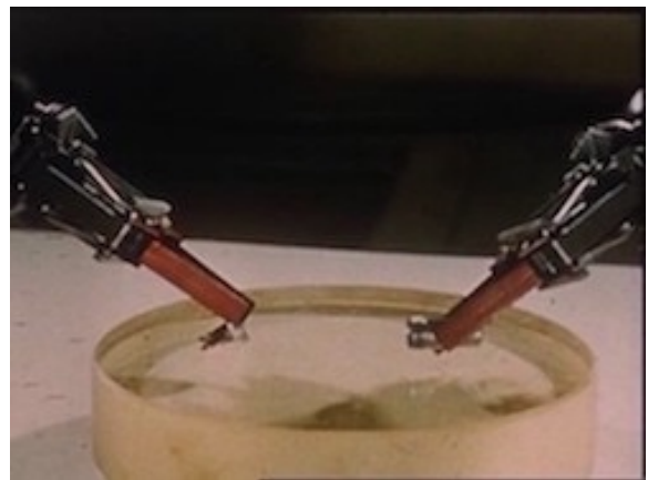
Images 10 et 11. Images d'installations du centre nucléaire Extraits du feuilleton Les Atomistes

À la fois pour les images originales et esthétiques qu'il offre et pour les ressorts qu'il propose en termes d'énigme, le travail en train de se faire est présenté avec détails et dans un grand respect de la réalité de cet univers pour autant qu'on puisse en juger à partir des images dispersées qu'on a pu consulter dans les documentaires contemporains du feuilleton qui sont cités plus haut et sur la base de différentes expériences d'observation participante du travail ouvrier qu'on a menées dans cet univers dans les années 1980 et 1990 (Fournier, 2012). Faute d'avoir accès à des archives écrites autour de la préparation de ce film, de l'écriture de son scénario et de son tournage, et en l'état des informations recueillies auprès des « acteurs », on ne sait pas exactement quel travail de repérage a été mené en amont 14 . Mais on peut dire que cette précision documentaire sur le travail tient a minima au tournage en décor naturel qui impose que, face aux installations techniques, le plus simple soit de faire se comporter les comédiens comme le font les « acteurs » ordinaires de ces lieux de travail. Cela tient sans doute aussi au contrôle qu'impose la direction du CEA sur ce tournage, sous les figures du service de la communication soucieux du projet de promotion du