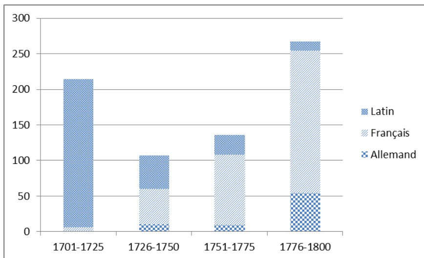
Fig. 2 – Répartition linguistique et chronologique des imprimés strasbourgeois du XVIII e siècle présents dans les bibliothèques nobiliaires aujourd’hui conservées en République tchèque

Le croisement des données thématiques et chronologiques montre en outre que les ouvrages de droit, presque tous en latin, tous issus de l’université, forment le gros des impressions des années 1700-1725, tandis que l’histoire est la discipline reine des années 1775-1800 et qu’elle est majoritairement présente en français. Nous avons donc affaire à deux types différents de lecture correspondant à des circulations intellectuelles distinctes.