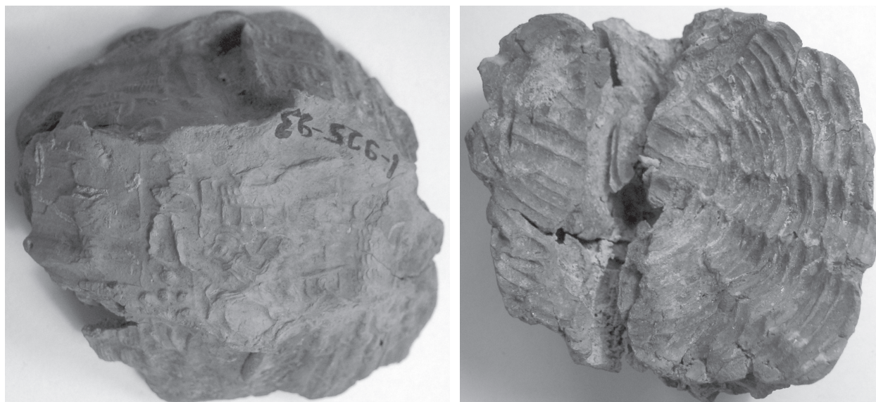
FIGURE 3 : BULLA KT 93/k 801 ; A. FACE ; B. REVERS.

porte l'impression du sceau d'Aššur-taklāku, l'un des propriétaires de la maison, et au revers montre les marques d'une structure de panier. Kt 93/k 810 a sur une face l'empreinte d'un sceau-cylindre et, sur l'autre, des traces de roseaux et de profondes rainures. Kt 93/k 267 est un bouchon d'argile en forme de champignon avec des impressions de sceau-cylindre et de sceau tampon en forme d'abeille et des marques de ficelles au revers. Les bullæ Kt 93/k 266, Kt 93/k 803, Kt 93/k 812, Kt 93/k 814, Kt 93/k 815 sont trop fragmentaires ; on distingue juste des restes d'empreintes de sceaux. Ces différentes bullæ ont donc servi à sceller des portes, des caisses en bois, des paniers, des ballots de marchandises emballées dans du tissu et des récipients à col.