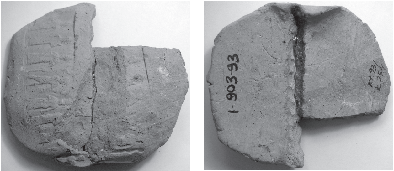
FIGURE 2 : BULLA KT 93/k 254 ; A. FACE ; B. REVERS.