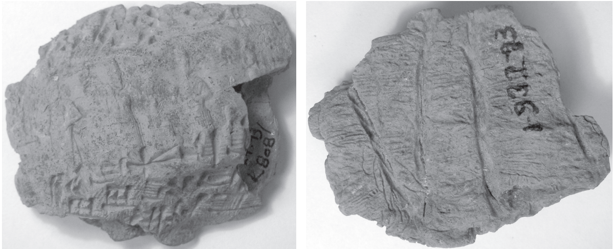
FIGURE 4 : BULLA Kt 93/k 808 ; A. FACE ; B. REVERS.

ensemble. Kurub-Ištar pourrait éventuellement être le fils d'Aššur-Šamšī qui intervient comme codestinataire d'une lettre sous enveloppe (Kt 93/k 379:3). Kurub-Ištar apparaît à deux reprises comme expéditeur d'une lettre à Iddin-Suen (Kt 93/k 251 et son enveloppe Kt 93/k 134 ; Kt 93/k 253) et une fois comme l'auteur d'une lettre à Ali-ahum (Kt 93/k 193). Le revers plat de cette bulla présente des rayures (bois ?) et est traversé par l'empreinte de deux ficelles qui se croisent perpendiculairement ; elle pourrait avoir servi à sceller un petit coffre à tablettes.