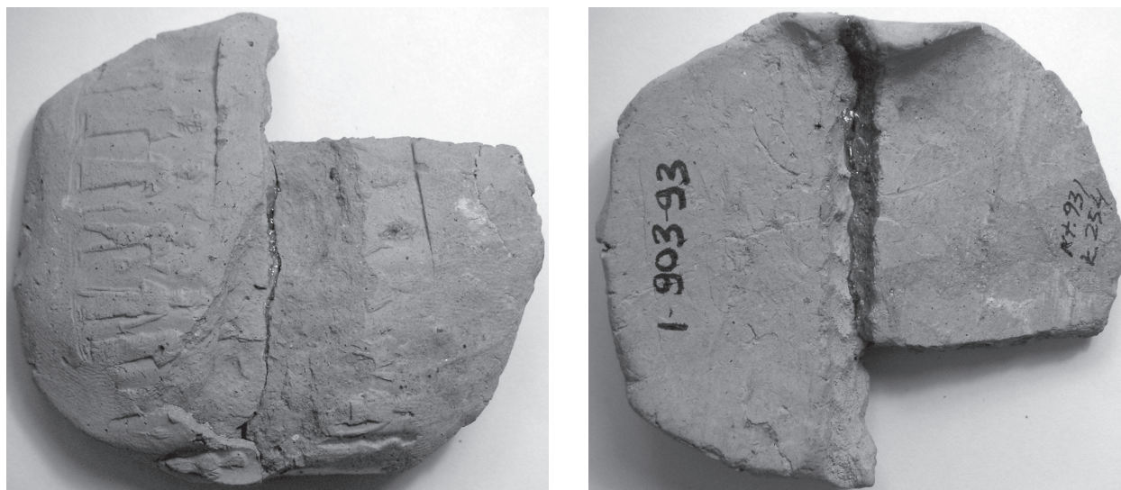
FIGURE 2 : BULLA KT 93/k 254 ; A. FACE ; B. REVERS.