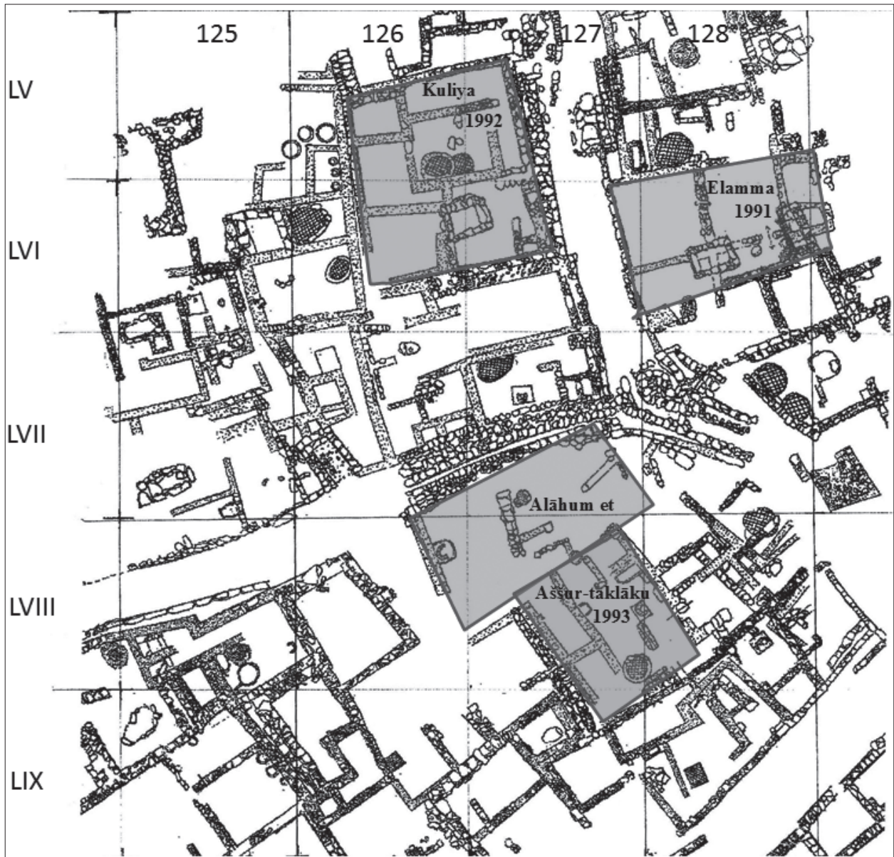
FIGURE 1 : SECTEUR DE LA VILLE BASSE EXPLORÉ ENTRE 1991 ET 1993. (MISSION ARCHÉOLOGIQUE DE KÜLTEPE).

sud de la rue pavée en pierre. Deux autres bullæ , aux numéros d'inventaire isolés, seraient également issues de cette maison : Kt 93/k 608 et Kt 93/k 650.