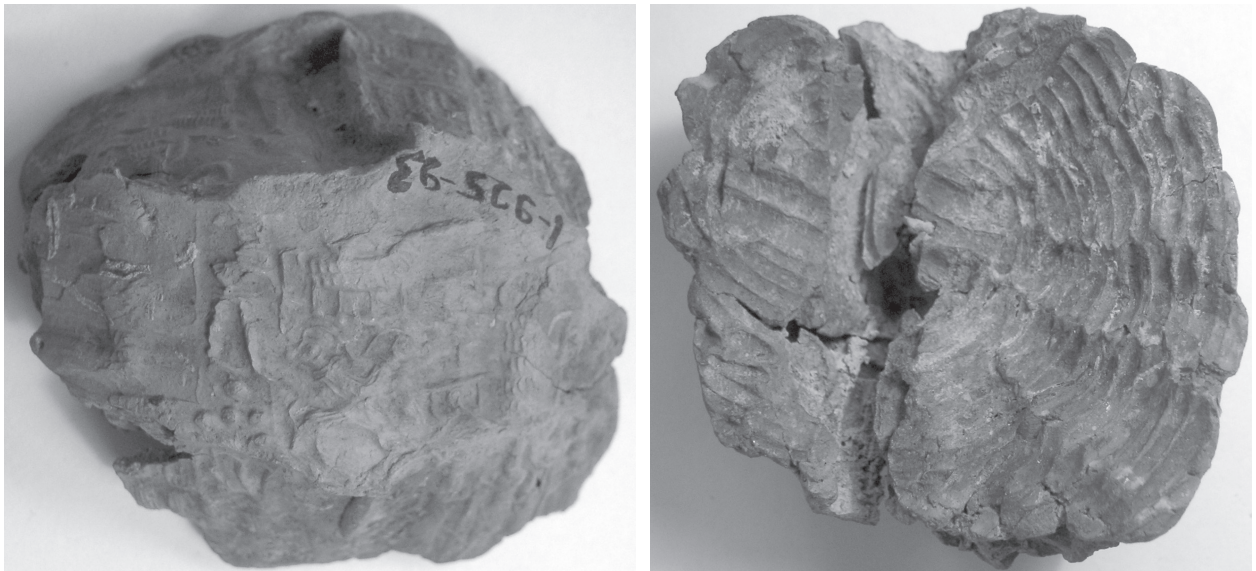
FIGURE 3 : BULLA KT 93/k 801 ; A. FACE ; B. REVERS.

porte l'impression du sceau d'Aššur-taklāku, l'un des propriétaires de la maison, et au revers montre les marques d'une structure de panier. Kt 93/k 810 a sur une face l'empreinte d'un sceau-cylindre et, sur l'autre, des traces de roseaux et de profondes rainures. Kt 93/k 267 est un bouchon d'argile en forme de champignon avec des impressions de sceau-cylindre et de sceau tampon en forme d'abeille et des marques de ficelles au revers. Les bullæ Kt 93/k 266, Kt 93/k 803, Kt 93/k 812, Kt 93/k 814, Kt 93/k 815 sont trop fragmentaires ; on distingue juste des restes d'empreintes de sceaux. Ces différentes bullæ ont donc servi à sceller des portes, des caisses en bois, des paniers, des ballots de marchandises emballées dans du tissu et des récipients à col.