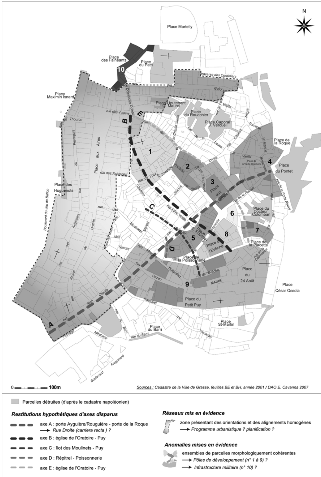
Fig. 3 Synthèse cartographique de l'analyse archéogéographique. Sintesi cartografica dell'analisi archeografica.