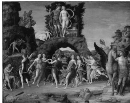
2. Lorenzo Costa, Couronnement d'une femme poète , Paris, Musée du Louvre.

Face à la pertinence de ces analyses, on regrette-