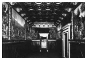
1. Palais ducal de Mantoue, appartement de la Corte Vecchia , Studiolo , photomontage montrant la disposition des peintures proposée par Brown. (d'après BROWN, 2005,

B i e n qu'antérieur, l'ouvrage de Clifford M. Brown paru en 2002