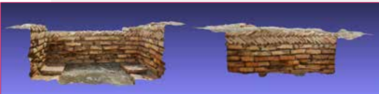
Fig. 10 - Sezione e prospetto del silos.