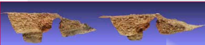
Fig. 12 - Sezione della glareata.

Le dimensioni e i tempi limitati per una documentazione grafica accurata, hanno spinto gli archeologi ad adottare tecniche di rilievo 2D e 3D che consentissero di acquisire tutti i dati possibili nel minimo tempo.