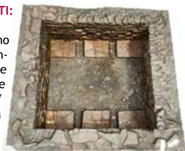
Fig. 7 - Modello texturizzato del silos.

Inoltre cfr. (Bezzi, Ducke 2010), soprattutto per la texturizzazione delle stesse (Fig. 7-8-9). Infine, sono state realizzate delle sezioni e dei prospetti degli oggetti (Fig. 10-11-12).