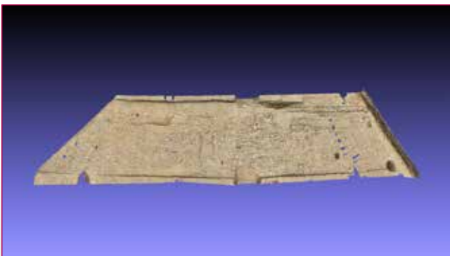
Fig. 3 - Nuvola di punti della glareata romana.

La camera di combustione/cottura, era formata da corsi di grossi ciottoli di rocce ignee e metamorfiche, abbastanza resistenti al calore, e poggiava su un gradino a forma di ferro di cavallo che circondava la parte centrale e più profonda, delimitata da una parete verticale e contigua a un condotto di accesso verso S. Questo cunicolo, chiuso in alto da un arco aggettante, era formato da medi e grossi