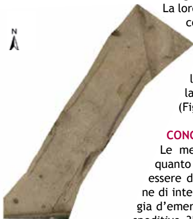
Fig. 13 - Fotopiano georeferenziale della glareata.

Le metodologie illustrate mostrano quanto le nuove tecnologie possano essere di supporto alla documentazione di interventi stratigrafici di archeologia d'emergenza. Le tecnologie di rilievo speditivo 3D e 2D offrono strumenti per