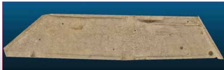
Fig. 6 - Vista zenitale del modello texturizzato della glareata.

Python Photogrammetry Toolbox (PPT) è un insieme di applicazioni SFM open source, implementato da Arc-Team e dotato di interfaccia grafica. L'uso di questo software consente diversi vantaggi: facilità di utilizzo, possibilità di abbattere i costi per ottenere rilievi 3D ad alta risoluzione, grazie alla licenza FLOSS (Free Software and Open Source). È stata utilizzata una fotocamera LUMIX DMC-TZ20 (14,1 Mpx, ottica Leica da 24/384mm), e, in un caso, una Nikon D700 (12,1 Mpx, ottica Nikkor, obiettivo da 18/200mm) e una GoPro Hero3 (Ottica f/2,8 con ultra grandangolo). Questo è stato possibile perché PPT è in grado di elaborare immagini realizzate con diverse fotocamere.