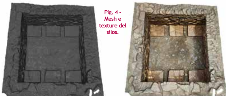
Fig. 4 - Mesh e texture del silos.

Il primo rilievo è stato realizzato sul silos. Da 120 fotogrammi è stata estrapolata una nuvola grezza di circa 405000 vertici (Fig.1). Il secondo rilievo è stato effettuato sulla fornace in ciottoli e laterizi. Vista la complessità della struttura, sono stati scattati circa 500 fotogrammi, ottenendo una nuvola grezza di circa 1700000 vertici (Fig.2).