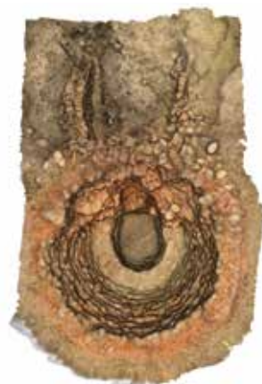
Fig. 8 - Modello texturizzato della fornace.

Nel corso di indagini stratigrafiche svoltesi nel comune di Rodano (MI) tale tecnica è stata utilizzata sul tratto di glareata romana.