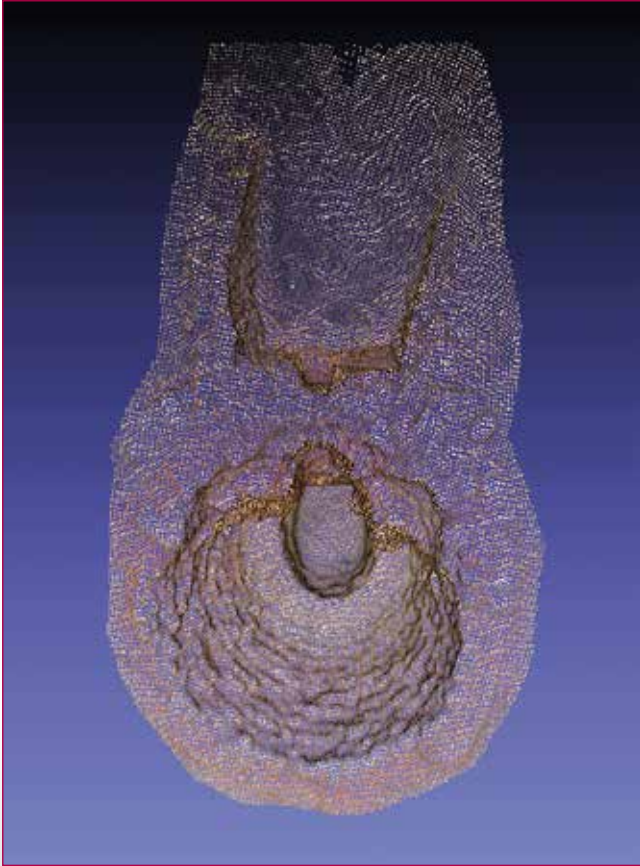
Fig. 2 - Nuvola di punti della fornace.

Si può ipotizzare che i 6 mezzi sesquipedali posati sul fondo del vano, direttamente sul terreno sterile, fungessero da appoggio isolante a una travatura di sostegno a una pavimentazione in assi, entrambe lignee.