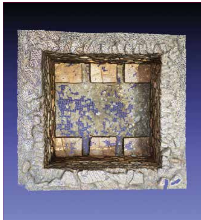
Fig. 1- Nuvola di punti del Silos.

Le applicazioni che verranno esposte sono state realizzate durante le attività archeologiche preventive per il nuovo collegamento autostradale Brescia-Bergamo-Milano (BreBe-Mi), lungo le opere connesse: lotti OH, OI e OM, condotte da CAL srl di Brescia con la direzione scientifica della Soprintendenza per i Beni Archeologici della Lombardia. La prima struttura, un silos seminterrato (Fig. 1), è stata indagata all'interno di un insediamento romano frequentato tra I e IV secolo d.C., situato a circa 1,3km dall'odierno abitato di Barriano, ad E della Cascina Limbo. Il settore sud era organizzato intorno a un piccolo edificio con fondazioni in muratura, alzati presumibilmente in terra e/o legno e tetto in embrici, suddiviso in almeno due ambienti, di cui quello a N ospitava un focolare che conservava tre piani di combustione. L'area a E dell'edificio ha restituito buche di palo e una fondazione che potrebbero testimoniare la presenza, in aderenza ad una cucina, di una tettoia o comunque di una struttura aperta. A NW del piccolo edificio è stato investigato il silos.