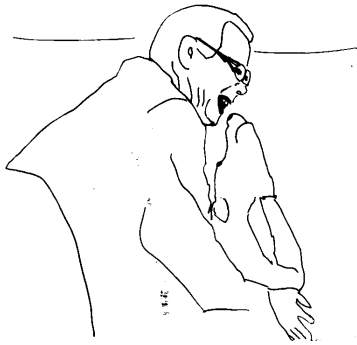
Image 2. Jacques se met à retrousser les lèvres, montrer les dents, et produire un léger bruit avec sa bouche (« niak niak niak niak ») en claquant des dents, à proximité immédiate de la gueule de la chienne.