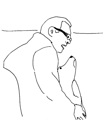
Image 3. La chienne redescend légèrement le museau, et Jacques cesse son claquement de dents durant quelques secondes, en cessant sa mimique.

Image 2. Jacques se met à retrousser les lèvres, montrer les dents, et produire un léger bruit avec sa bouche (« niak niak niak niak ») en claquant des dents, à proximité immédiate de la gueule de la chienne.