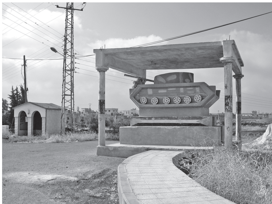
Fig. 4 - Monument 4, à Nijran.

monuments ne reçoivent pas ou plus de visites. Les parterres de fleurs sont entretenus quelque temps puis abandonnés, les monuments eux-mêmes résistent mal aux intempéries et ne sont pas restaurés.