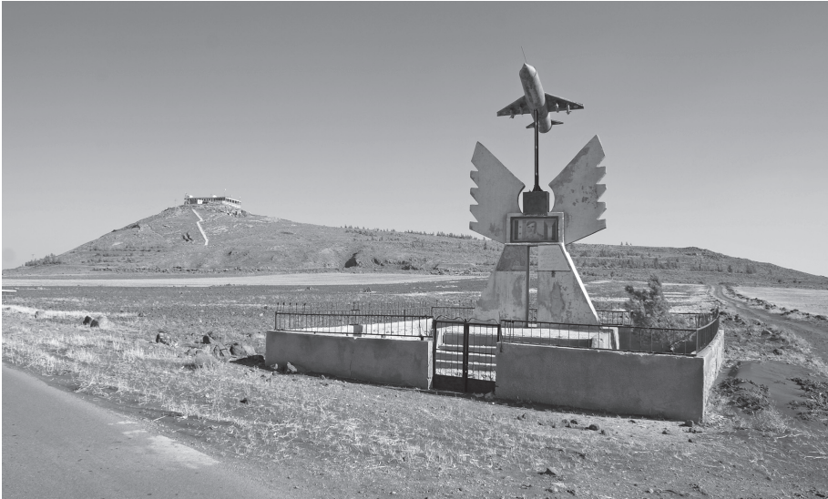
▲ Fig. 2 - Monument 43, à Imtan.