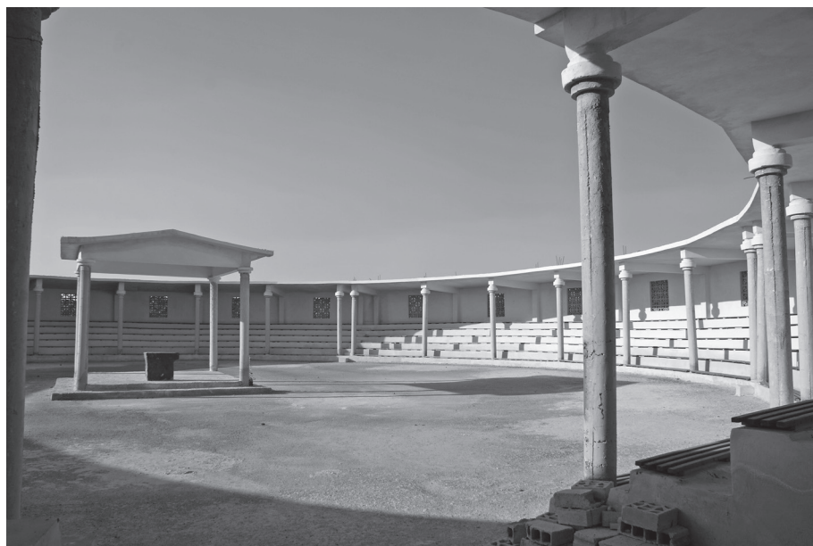
Fig. 5 - Mawqaf circulaire fermé, à Salakhed (Léjà).

avons repérés sont modernes, construits en béton et métal; nous n'avons pas remarqué de mawqaf ancien. Pourtant, William John Bankes, un explorateur anglais qui releva un grand nombre d'édifices dans la région, dessina en 1818, à Qreiyeh, les vestiges d'une installation décrite déjà par tous les voyageurs qui l'avaient précédé depuis 1805, présentant sept rangs de gradins couverts de dalles de basalte portées par des rangées de colonnes. Toute la construction emploie des blocs antiques. Cet édifice pourrait correspondre à un ancien mawqaf 42 .