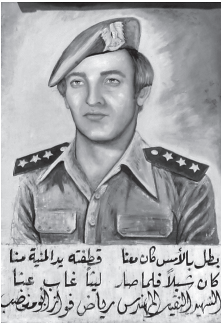
◀ Fig. 3 - Monument 35, à Baham.

elle n'est pas visible, peut-être enterrée sous la construction. Souvent, le portrait du défunt accompagne l'épithape en arabe portée par le monument, signalant, sous le mot fātiha qui désigne la première sourate du Coran, son nom, ses dates de naissance et de décès, le détail parfois fourni de sa carrière avec ses titres et ses grades, la cause de sa mort et quelques versets coraniques ou vers célébrant son martyr (fig. 3). Ce portrait peut avoir plusieurs types de supports : photographies en couleur, ou en noir et blanc et alors parfois coloriées, bas-relief sur plaque en métal repoussé, peintures probablement sur bois, buste en