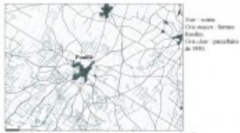
Fig. 1. Complétion des formes planimétriques actives et fossiles.