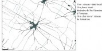
Fig. 2. Les différentes formes analysées et interprétées.