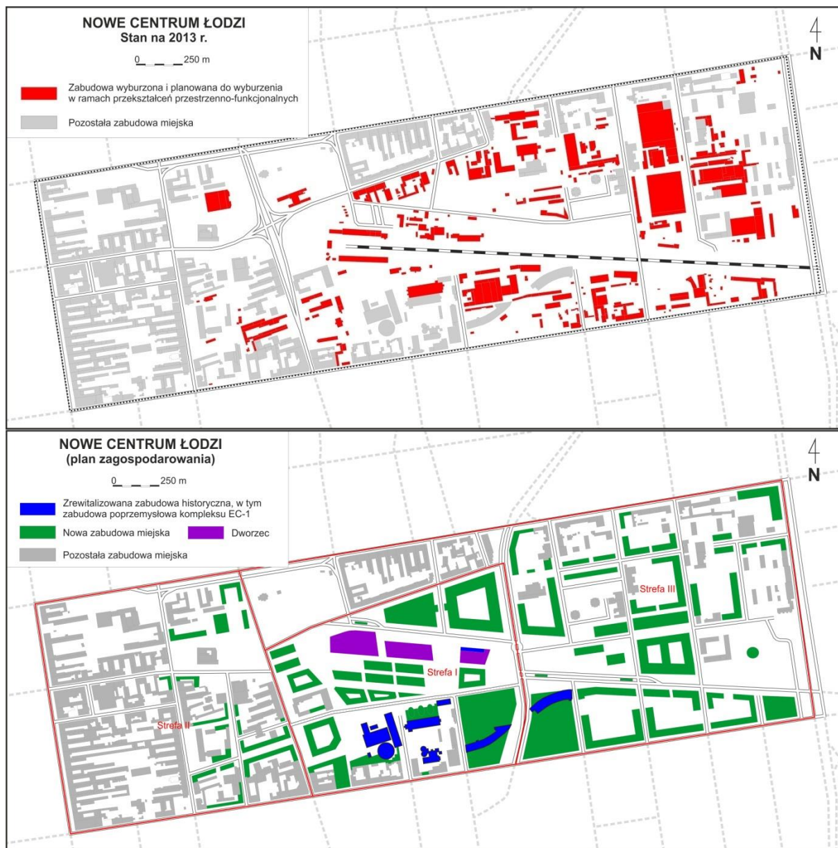
Rys. 3. Przekształcenia przestrzenne w kwartałach śródmiejskiej objętych projektem „Nowe Centrum Łodzi”.

W roku 2007 Rada Miasta podjęła uchwałę o odnowie obszaru przemysłowego wzdłuż linii kolejowej prowadzącej do dworca kolejowego Łódź Fabryczna. W ramach wielkoskalowego projektu pod nazwą „Nowe Centrum Łodzi” o powierzchni 100 ha został wybudowany podziemny dworzec kolejowo-autobusowy, natomiast tereny ponad tunelem i dworcem w kwartałach ograniczonych ulicami Piotrkowską, Narutowicza, Kopcińskiego i Tuwima są przeznaczone pod nową zabudowę o zróżnicowanych funkcjach z dominacją usług (47%) i terenów mieszkaniowych (12%). W ramach prowadzonych działań rewitalizacyjnych planowane są liczne prace rozbiórkowe finansowane z środków publicznych, co ma zwiększyć atrakcyjność inwestycyjną tej części miasta. Zgodnie z planami przebudowy w części centralnej (strefa I) oraz