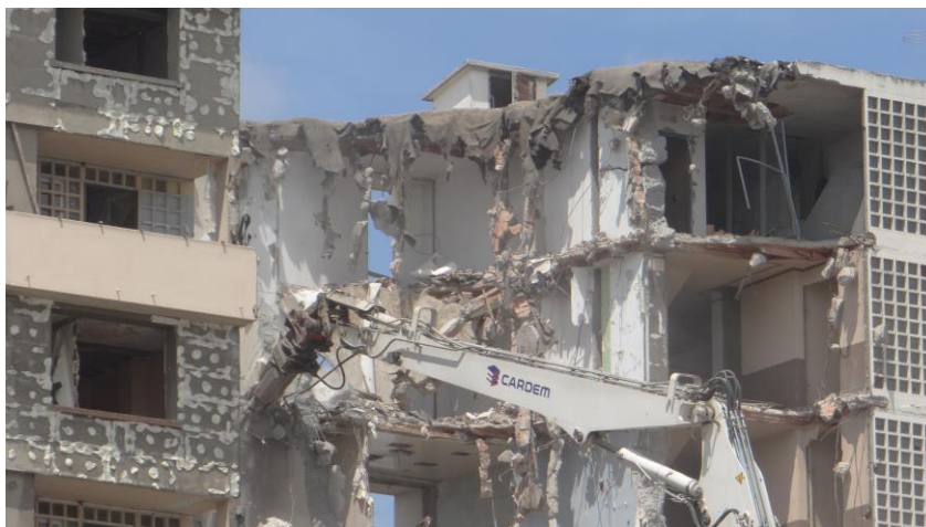
Foto 2 : Dekonstrukcja szczypcem struktury betonowej po usunięciu materiału wewnętrznego - Lyon, L. Mongeard, 2013

Są one oddzielane od siebie, oznaczane odpowiednio i następnie traktowane w różny sposób i przy ewentualnym ponownym wykorzystaniu. Tym samym funkcjonowanie sektora profesjonalnego powiązanego z procesem demolowania jest ważnym zagadnieniem, ponieważ kolejne etapy dekonstrukcji i relacje między rozbiórką a recyklingiem, pokazują, że technologia wyburzeń i rozbiórek może być częścią polityki "zrównoważonego miasta". Działania przeprowadzone w tym zakresie na terenie aglomeracji w Lyonie doskonale dokumentują znaczenie sektora budowlanego w procesie zarządzania odpadami wytwarzanymi podczas przekształcania miasta. Ponadto jak wskazuje praktyka powtórnie użycie odpadów rozbiórkowych ma również istotną wartość ekonomiczną (pośrednio obniża koszty prowadzonych inwestycji), i staje się w ten sposób w rzeczywistości najbardziej atrakcyjnym rozwiązaniem, często stosowanym. Skuteczność wprowadzenia tego typu postępowania do sektora budowlanego wynika po części także z faktu istnienia silnych, powiązań lokalnych społecznych i instytucjonalnych oraz z zastosowania odpowiednich rozwiązań organizacyjnych na obszarze miasta ale i regionu w Lyonie (np. utworzenie platform recyklingowych ułatwiających kontakty między interesariuszami tych działań).