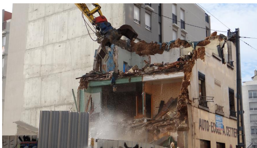
Foto 1: Demolowanie bez preparacji budynku dla segregacji odpadów– Villeurbanne, L. Mongeard, 2013

Dzisiaj stosowana praktyka dekonstrukcji przebiega w ściśle określony odpowiednimi procedurami sposób, polega przede wszystkim na oczyszczeniu budynku poprzez usunięcie niebezpiecznych elementów (ołów, azbest), a następnie zastępowanie ich innymi bezpiecznymi materiałami wykończeniowymi. Ma miejsce również celowe obniżenie struktur poprzez zmniejszenie liczby kondygnacji (demontaż) (foto 2). W efekcie operacji rozbiórkowych i wyburzeniowych powstają trzy rodzaje odpadów segregowanych według stopnia szkodliwości a mianowicie: niebezpieczne, nie obojętne, bezpieczne i obojętne.