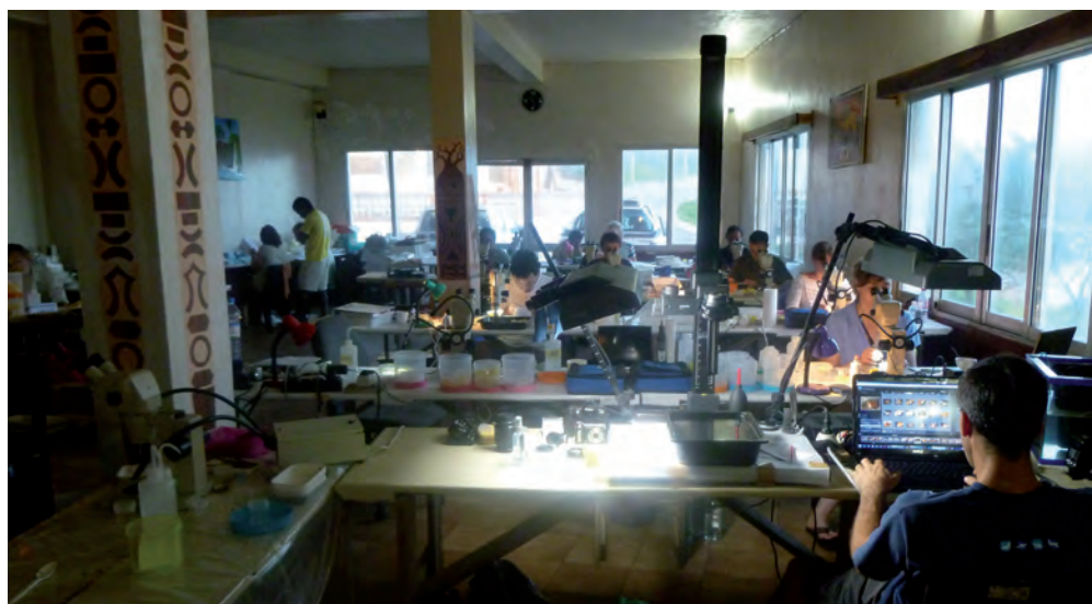
Lieu 3. Le laboratoire de tri in situ : Comparer, observer, trier.

Chaque spécimen est également « fixé » (on ne dit pas « tué » 25 ) et mis en alcool afin de lui permettre de quitter définitivement sa première vie, d'acquérir l'éternité requise par la vie scientifique. À la fin de cette étape, le processus d'identification et