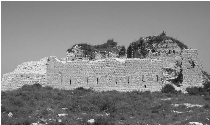
Fig. 3. Le kastron byzantin (J. Aliquot, 2008)