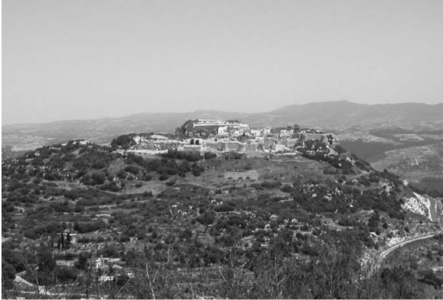
Fig. 2. Le site de Balātunus, vue du sud-ouest (J. Aliquot, 2008)