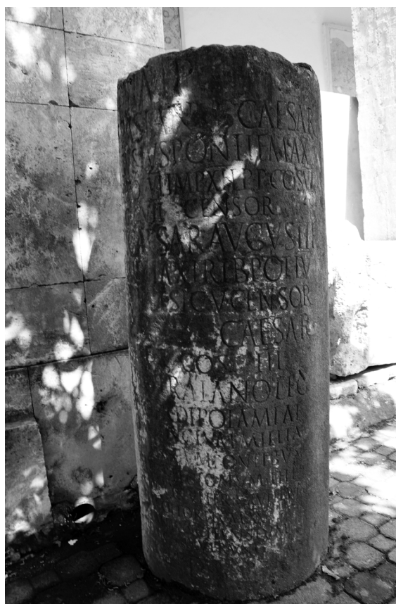
Figure 6. Borne milliaire de la dérivation du fleuve de la Dipotamie