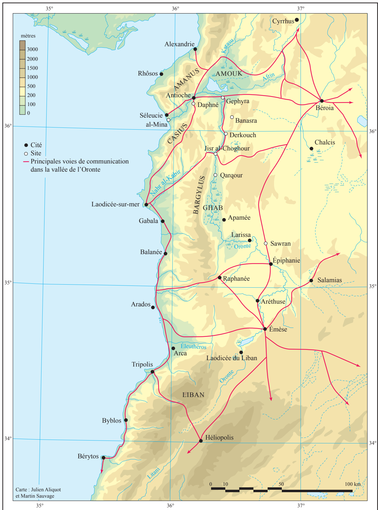
Figure 1. Le bassin de l'Oronte et les cités de la Syrie du Nord romaine © J. Aliquot, M. Sauvage