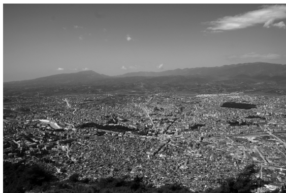
Figure 5. L'Oronte à Antioche

D'après le nom de la région qu'il traverse, le fleuve de la Dipotamie acheminait les eaux de deux rivières, sans doute celles de l'Oronte et de l'émissaire commun de deux torrents irréguliers, le Karasu et l'Afrin, dont les flots convergent dans la plaine d'Antioche au nord de la ville 53 . Il est différent de celui qu'évoque Pausanias (5), qui pourrait bien avoir été construit ou reconstruit sous Vespasien, mais qui concerne le tronçon de trente kilomètres entre Antioche et la mer 54 . Sa dérivation a été réalisée par des détachements de quatre légions et de vingt cohortes. Le légat Marcus Ulpius Traianus (73-78), qui a supervisé les travaux, n'est autre que le père du futur empereur Trajan, dont le rôle dans la Syrie de Vespasien est bien connu par ailleurs. À Séleucie, le même personnage ou son successeur immédiat Lucius Ceionius Commodus a pu faire creuser une impressionnante tranchée de dérivation afin de détourner les eaux d'un torrent qui dévalaient du mont Coryphée et qui menaçaient continuellement le port de la ville 55 . Selon van Berchem, les aménagements hydrauliques en amont d'Antioche auraient appartenu à un vaste plan d'ensemble qui prévoyait la mise en place d'infrastructures militaires destinées à faciliter l'intervention de Rome face aux Parthes.