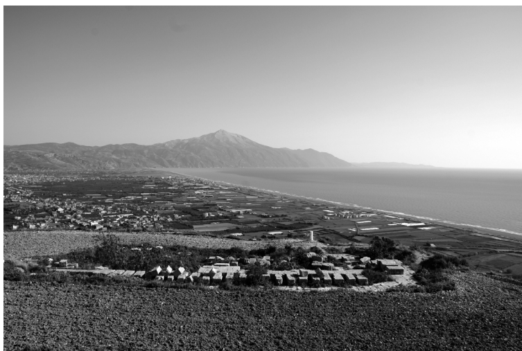
Figure 2. La baie de Séleucie, l'embouchure de l'Oronte et le Casius