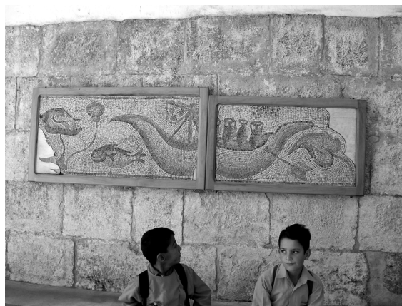
Figure 4. Navire sur une mosaïque protobyzantine de Sawran conservée au musée d'Apamée

dans le rocher, d'une carrière à ciel ouvert, d'un pont et de très nombreuses tombes rupestres d'époque romaine ou protobyzantine 40 . L'hypothèse est a priori attrayante, vu la situation des vestiges conservés, sur la rive gauche de l'Oronte et à l'intérieur d'un méandre. Cependant, le plan et les clichés publiés ne garantissent pas que les blocs de moyen et de grand appareil qui sont aujourd'hui immergés à cet endroit appartiennent bien à un quai à deux degrés ; de même, l'identification des installations rupestres avoisinantes à des grottes culturelles païennes laisse perplexe (on pense plutôt à des habitations, à des locaux utilitaires et à des tombes).