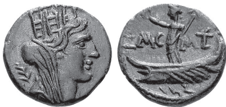
Fig.3. Bronze tyrien daté de 121/122 apr. J.-C., semblable à RPC , III, 3901 (Collection privée).