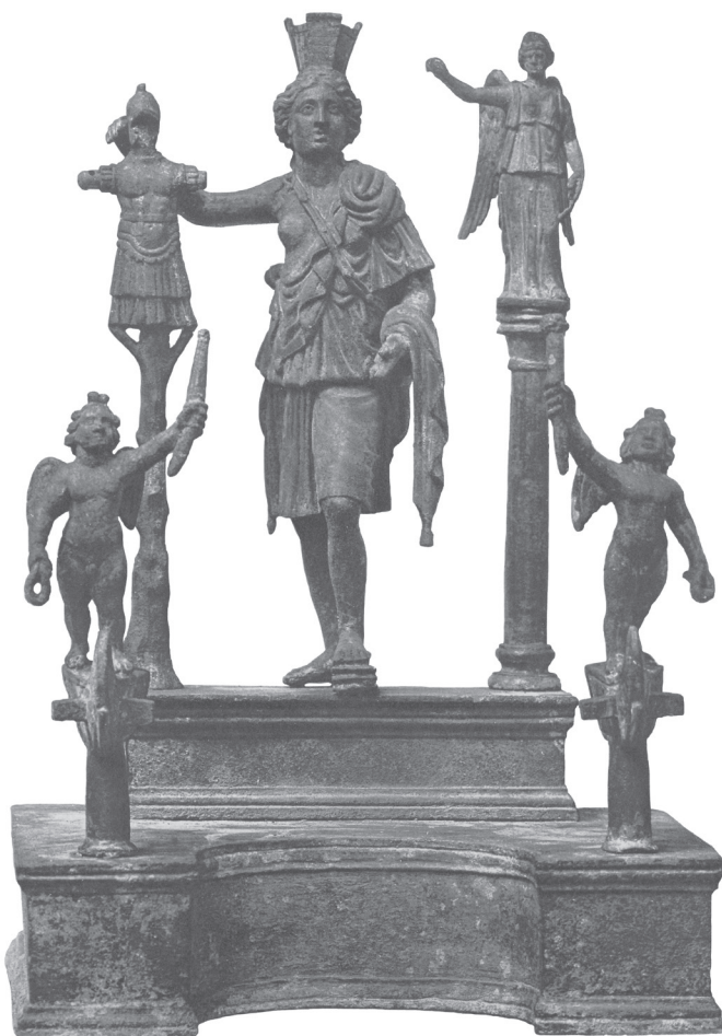
Fig.4. Le Laraire de Tortose (d'après A.De Ridder, Monuments Piot , 12, 1905, pl.6).