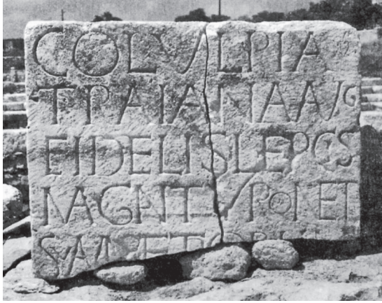
Fig. 1. Dédicace bilingue de Lepcis Magna à la cité de Tyr, sa métropole : la version latine ( I. Tyr , 48).