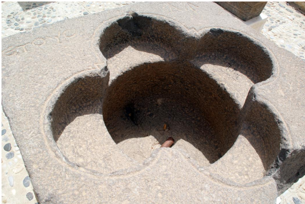
Fig. 2 : Cuve baptismale en basalte, l'ouverture du bassin et la date (Musée de Dayr 'Atiyya, Julien Aliquot 2010).