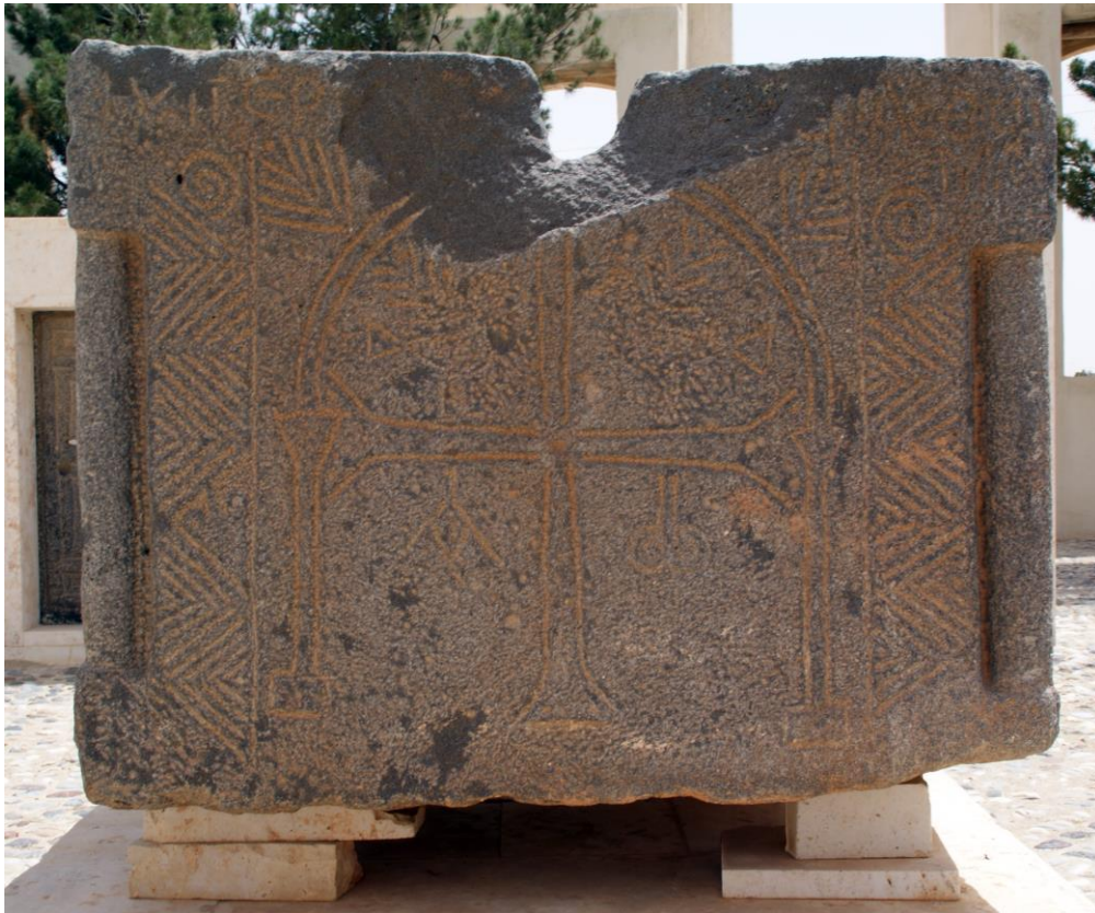
Fig. 1 : Cuve baptismale en basalte, la face principale inscrite (Musée de Dayr 'Atiyya, Julien Aliquot 2010).