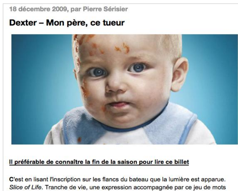
Fig. 6 - En-tête du billet sur le blog « Le Monde des séries », une fois ajouté l'avertissement. En plus du verbe de la phrase, le journaliste a tout de même oublié de mentionner le numéro de la saison en question.

« Alors oui, la convention est d'afficher "Attention spoilers" avant d'écrire un tel article, en effet. Ceci dit, faut être couillon pour lire l'article jusqu'au bout, alors qu'au 3ème paragraphe, on voit de suite que la fin va être révélée dans l'article... » (JP)