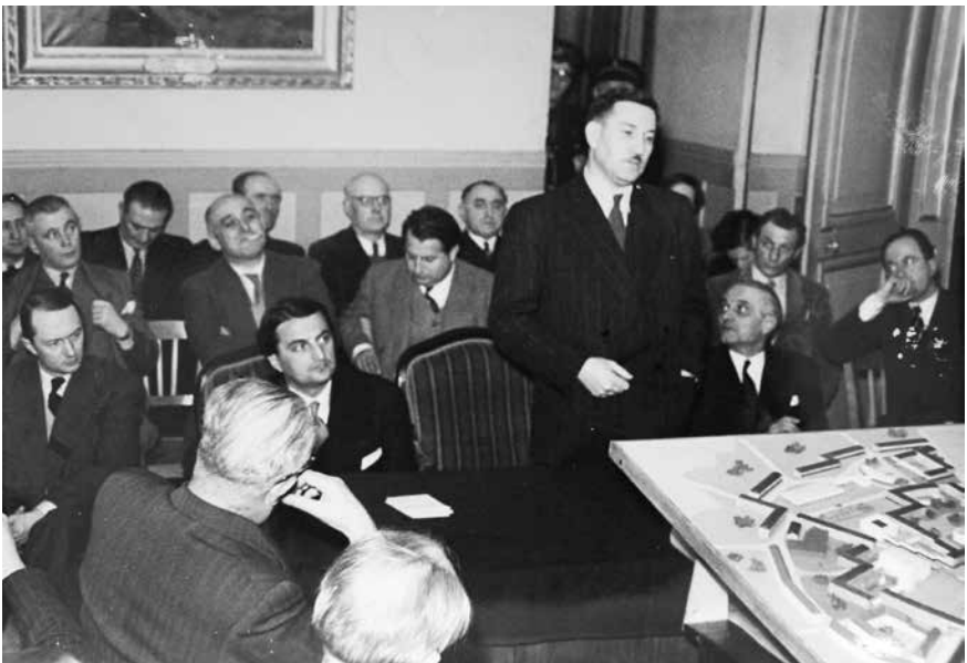
Fig. 3 – Eugène Claudius-Petit présentant la maquette du nouveau plan de reconstruction d'Abbeville, dit « plan Tambuté », en janvier 1951 (en présence de Max Lejeune, à sa gauche)