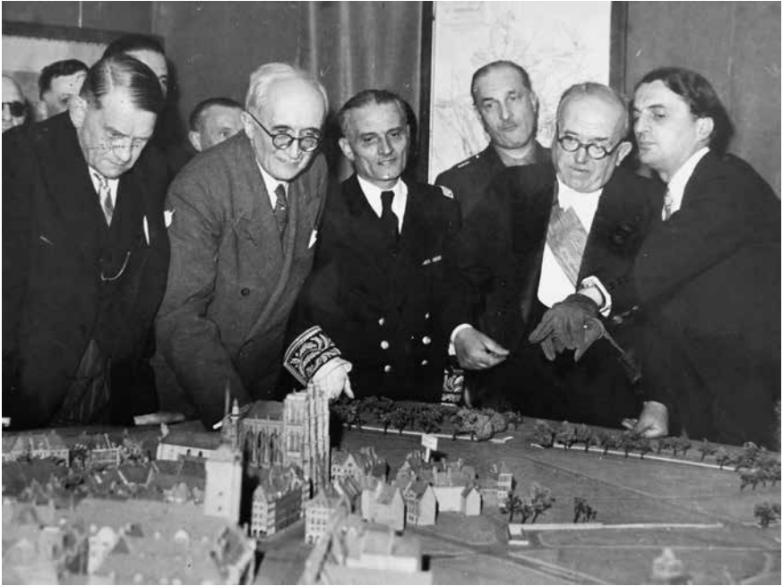
Fig. 2 – René Coty, Jacques Gréber, Vincent Auriol et Max Lejeune devant la maquette du premier plan de reconstruction d'Abbeville, dit «2nd plan Gréber», le 8 mai 1948