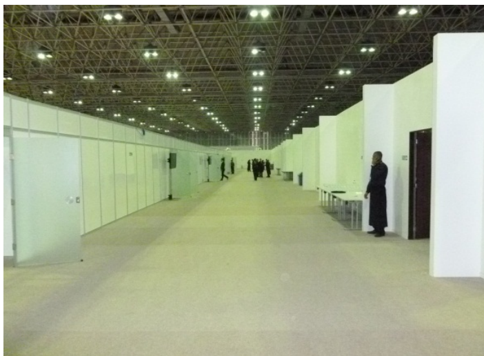
« Les couloirs de Riocentro » Délégation officielle