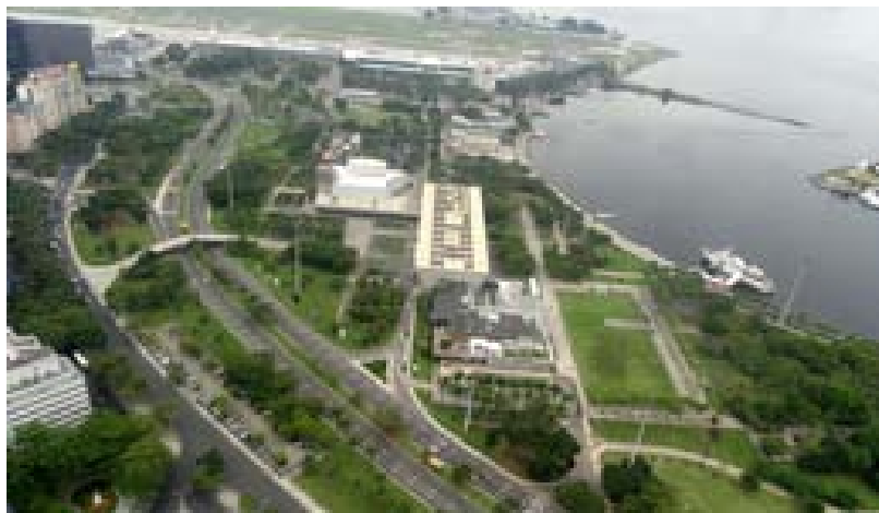
« Parc de Flamengo (Parque do Flamengo) »

Le Sommet des peuples se tient sur le même lieu (parc de Flamengo) que celui où les ONG s'étaient réunies vingt ans plus tôt et s'oppose donc a priori aux activités de la société civile « cooptée » se tenant à Riocentro. Néanmoins, l'organisation du Sommet des peuples reste bien intégrée à la programmation d'ensemble Rio+20. Malgré son succès mitigé, sa forme est celle d'un Forum social mondial, une forme déjà bien institutionnalisée et enrichie depuis 2001. Cette forme se définit comme un « espace ouvert » (Wallerstein, 2004 ; Cardon et Agrikolansky, 2005) pour la « convergence » des mobilisations et se caractérise par sa diversité interne et son accumulation de formats de rassemblement (colloque/foire/assemblée/mobilisation).