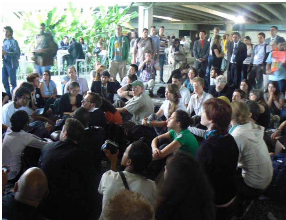
Seating interne à Riocentro

Un espace spécifique dans le bâtiment 3 est réservé aux nombreuses conférences de presse, le Media Center (bâtiment 3). Enfin, comme au sein du processus de négociation diplomatique, de nombreuses petites salles sont réservées à des réunions fermées par groupe affinitaire visant à signer un partenariat ou organiser une mobilisation.