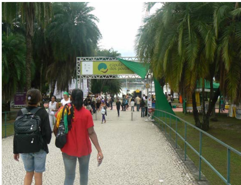
« Le portail d'entrée du Forum des peuples »