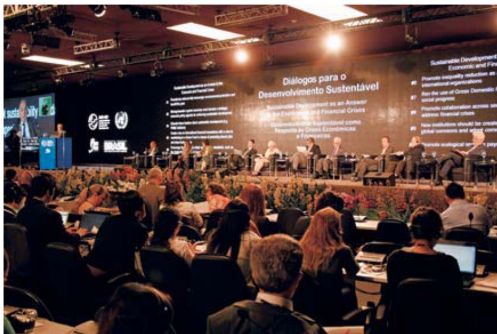
« Le dispositif du SD Dialogue »