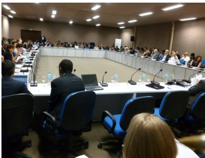
« Salle de négociation splinter group n° 5 »