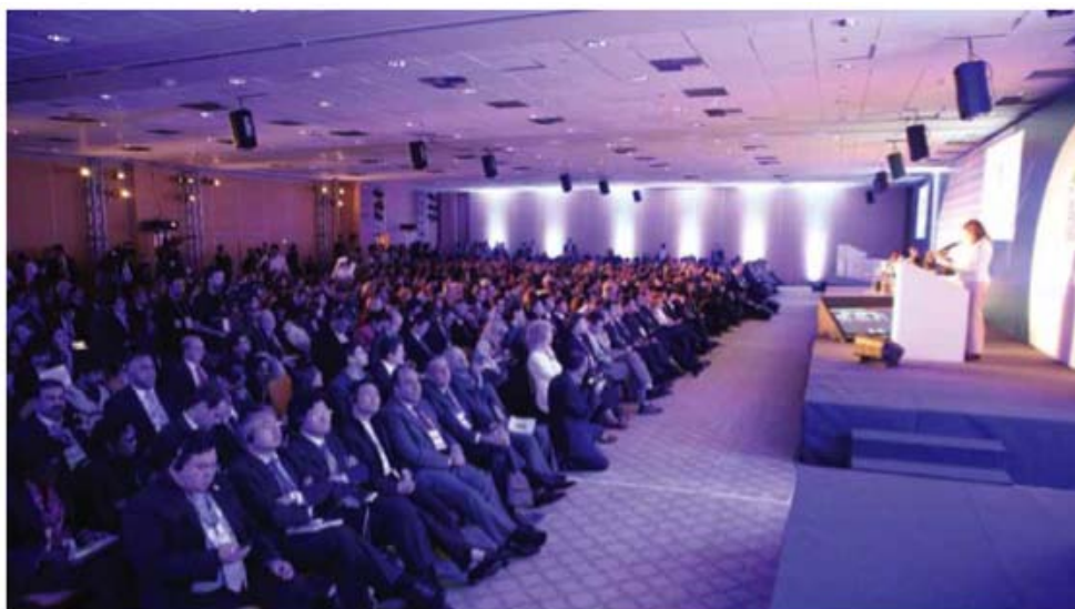
« Le Global Sustainability Forum (entreprises) »