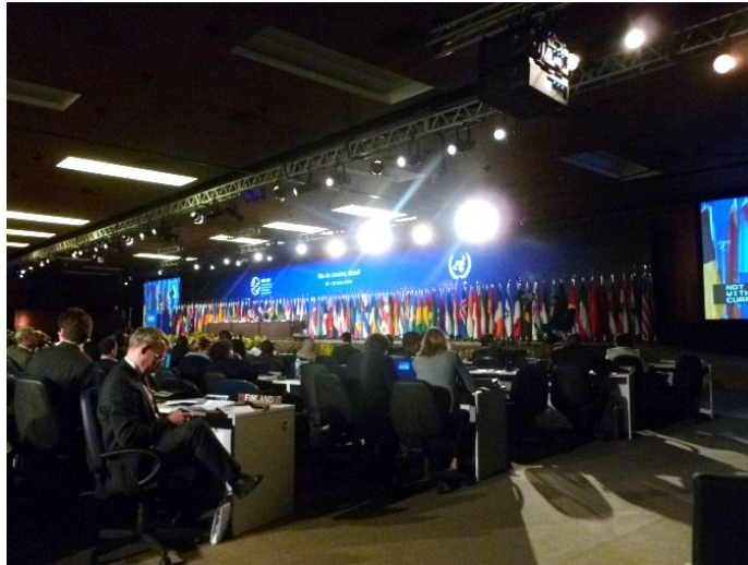
Le format « Interactive session » et le format « Conférence plénière »