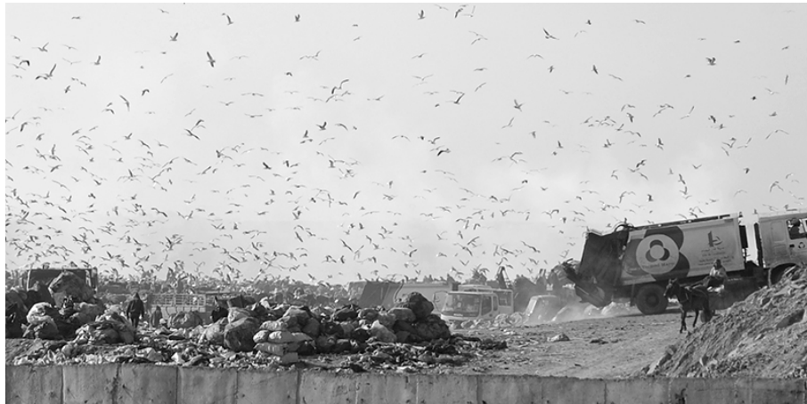
Figure 5 – L'intérieur de la décharge de Médiouna en 2012

choses. Récupérer à Salé, ville à la mauvaise réputation, régulièrement décriée comme étant pauvre, dangereuse et désorganisée, apparaît comme un facteur aggravant. Les représentations dégradantes des lieux déteignent sur ceux qui les manipulent.