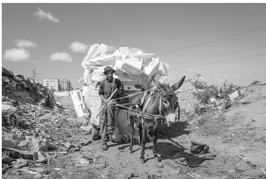
Figure 1 – Un récupérateur du quartier des grossistes de Lahraouine avec son chargement de polystyrène revendu comme isolant dans le bâtiment. Nous précisons que les photos de cet article ont été prises avec l'accord des intéressés. © Pascal Garret 6 , Casablanca, 2016

Or, notre recherche menée auprès de récupérateurs de déchets à Rabat-Salé et Casablanca montre que, s'ils sont conscients des jugements portés sur eux, ils élaborent cependant un contre-discours relativisant ces catégories et stigmatisations à leur encontre. Ce discours de légitimation de leur place en ville et de leur rôle en faveur de la société est à leurs yeux d'autant plus nécessaire que l'indésirabilité à leur égard se matérialise aussi par de nombreux obstacles réduisant leurs activités de collecte de la ressource qu'est le déchet et menaçant leur gagne-pain. Liée aux politiques publiques, cette régulation de l'indésirabilité oscille entre élimination, contrôle, formalisation et inclusion de ces « travailleurs des déchets » (Corteel, Le Lay, 2011).