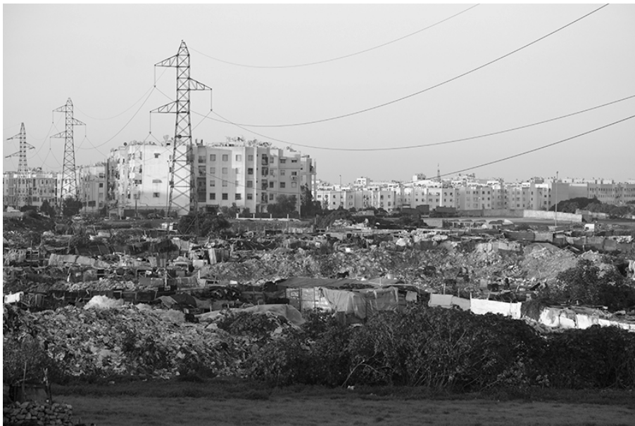
Figure 2 – Lahraouine, un quartier isolé et enclavé

Si Lahraouine se présente comme un isolat, ses activités sont néanmoins reliées à l'économie urbaine par les va-et-vient quotidiens des charrettes des bouâra et des 70 camions des grossistes qui y achètent plastiques, cartons, ferraille, bouts de tuyaux, polystyrène, chutes de tissus, laine, mousses, bourre de matelas, etc. Ces circulations témoignent bien que, malgré leur indésirabilité, les récupérateurs sont toutefois utiles en tant que fournisseurs en matières premières de l'industrie du recyclage.