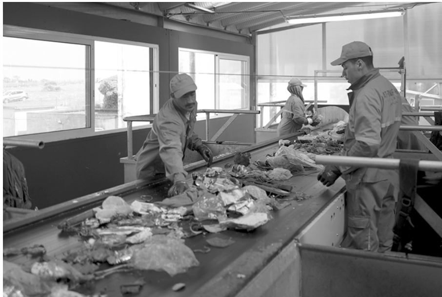
Figure 6 – Les travailleurs et travailleuses de la coopérative d'Oum Azza © Pascal Garret, Rabat, 2017

travers à le versement de subventions aux communes délégantes. Il comporte un « volet social », auquel à peine 2 % du budget total sont affectés, qui consiste à développer le recyclage en intégrant les récupérateurs informels dans des centres de tri.