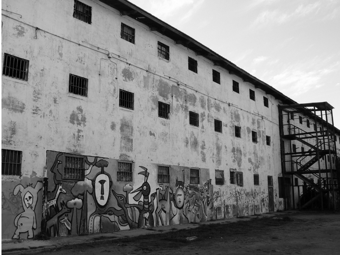
Façade postérieure de la galerie, 2007 (Camila van Diest, 2007).

rassemblant archives et objets de la prison. Dans le même temps ils favorisent l'usage du lieu par des artistes locaux en manque d'espace : dans ce cadre, d'anciennes cellules de détenus sont équipées en tant qu'ateliers par des plasticiens et sculpteurs et en tant que lieux de stockage par des gens de théâtre.