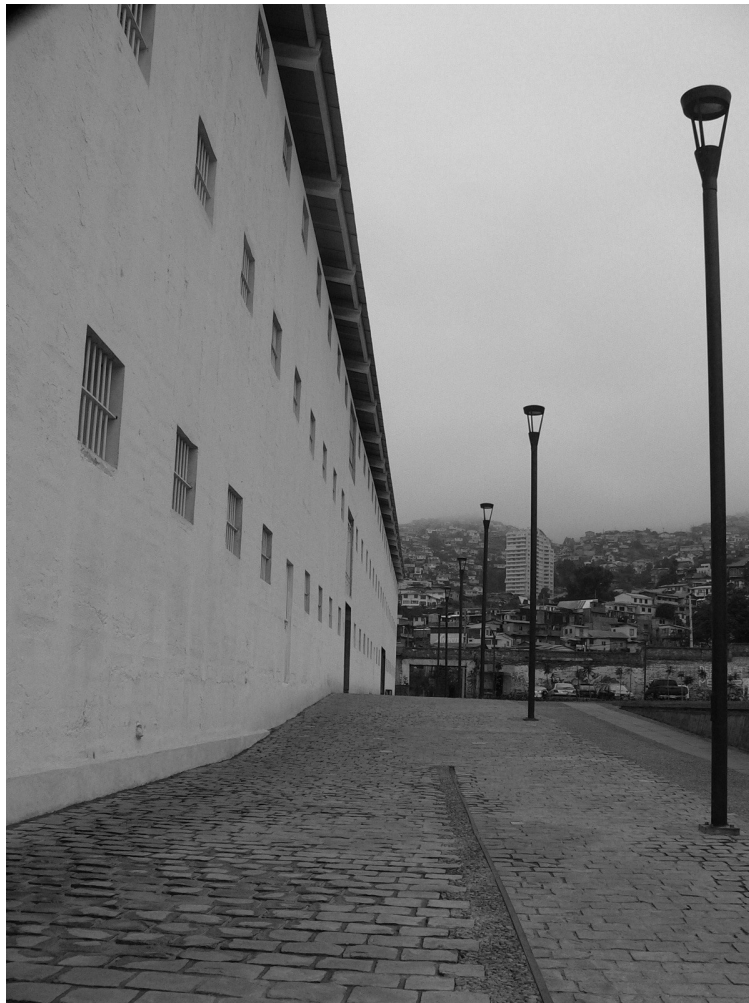
Façade principale, galerie de l'Ex cárcel restaurée (Camila van Diest, 2012).