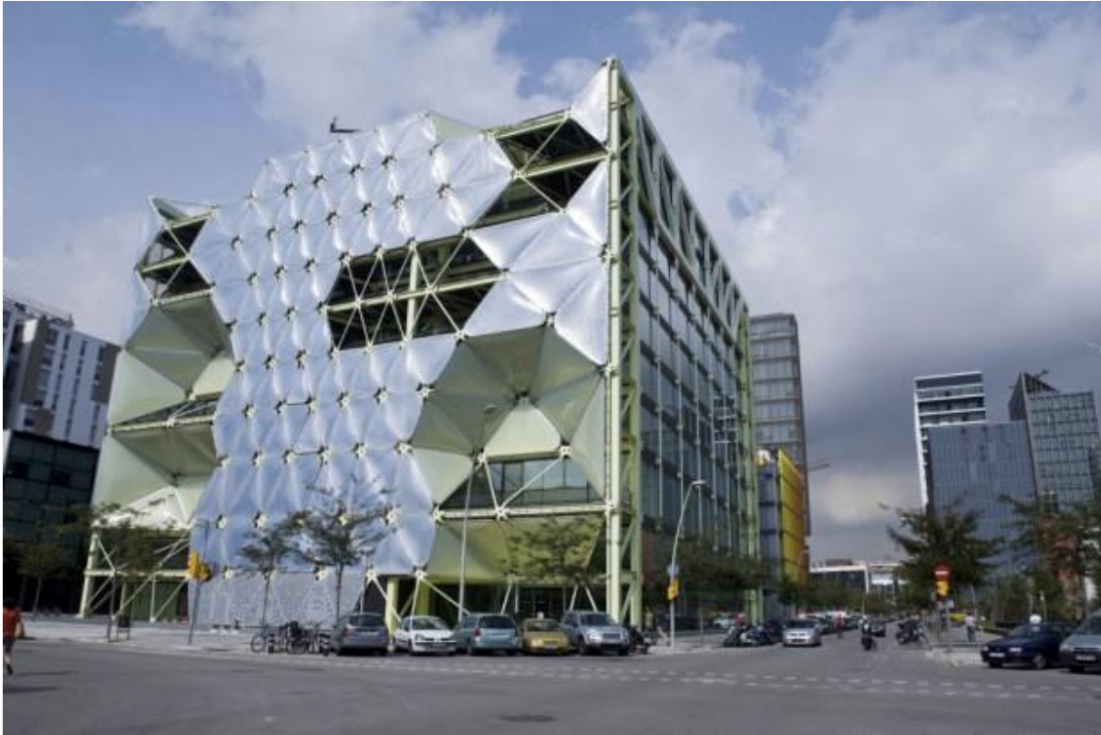
Le Media TIC Building. Icône architecturale de 22@.

Si la capacité d'attraction des activités innovantes de Poblenou a été unanimement reconnue, un certain nombre d'auteurs émettent néanmoins quelques réserves et déconstruisent le paravent esthétique de ce quartier créatif. A l'instar d'Horacio Capel et Antònia Casellas qui soulignent les difficultés du modèle à s'ancrer dans les problématiques locales, et à assurer une planification fondée sur une vision partagée de l'aire métropolitaine (Capel 2005 ; Casellas 2006). D'autres critiquent le caractère élitiste des emplois offerts par 22@, qui s'adressent principalement à des cadres, ingénieurs et designers de haut niveau et souvent à des candidats venus d'ailleurs.