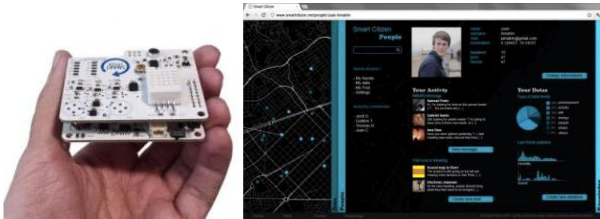
Le kit Smart Citizen et la plateforme contributive d'affichage des données