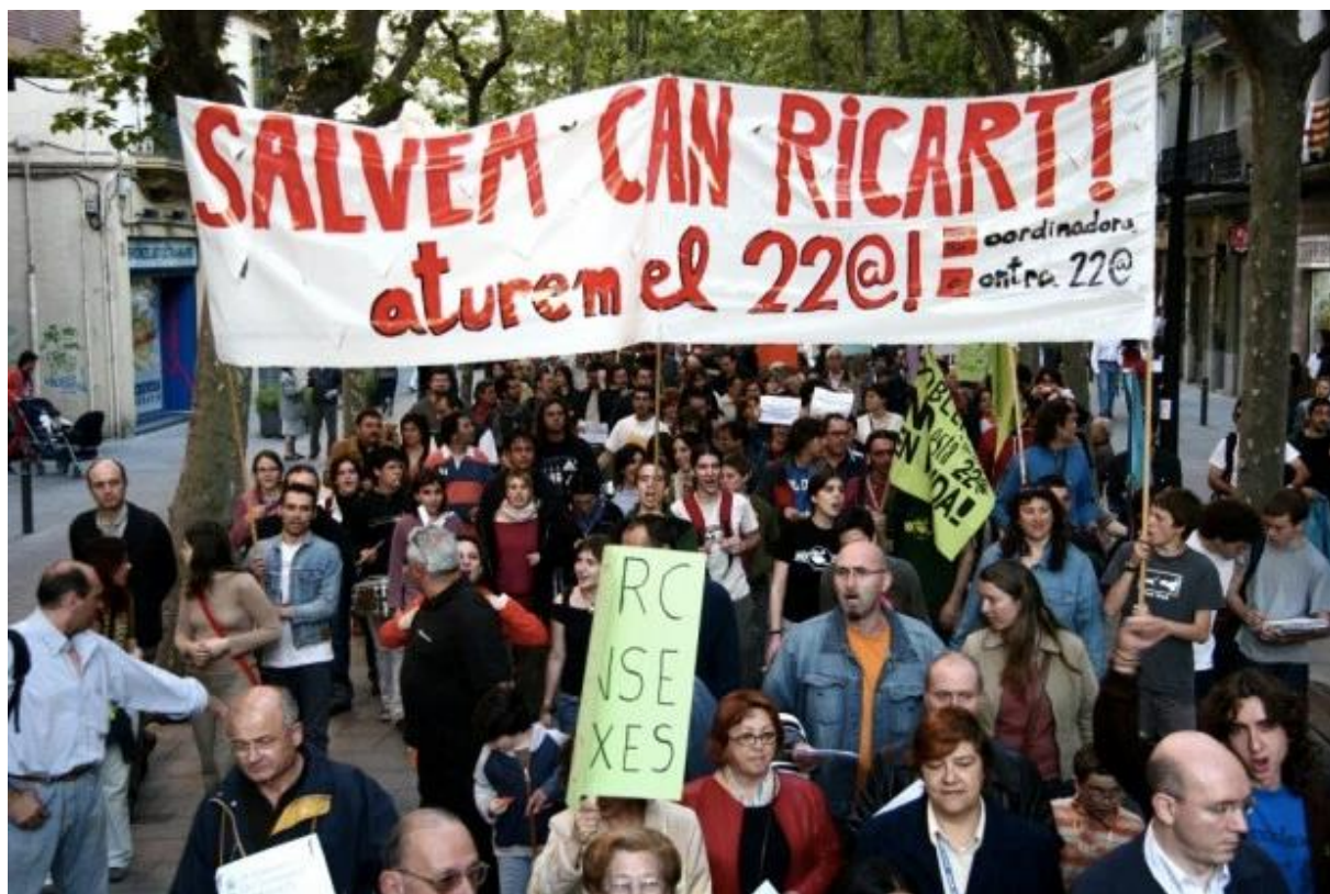
Manifestation du collectif « Salvem Can Ricart » contre le projet 22@

Au delà des critiques adressées au projet 22@, la crise économique va jouer un rôle dans la transformation du modèle barcelonais de ville créative. Face aux difficultés croissantes de la puissance publique à répondre aux problèmes de logement, de santé ou d'éducation, les barcelonais s'organisent pour imaginer collectivement des politiques alternatives. Récemment, une étude a recensé environ 700 pratiques d'innovation sociale en Catalogne, depuis la crise économique de 2008 (Blanco, Cruz, 2014).