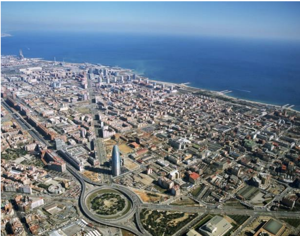
Le modèle barcelonais

L'enjeu : attirer les activités cognitives à forte valeur ajoutée, en lien avec les industries créatives, les technologies de l'information et de la communication (TIC) ou les biotechnologies. Afin de légitimer ce positionnement, Barcelone invoque une longue tradition dans les domaines de l'imprimerie, de la publicité, de l'architecture ou du design, et survalorise un héritage culturel issu de personnalités comme Gaudi, Picasso, Joan Miró ou Salvador Dali.