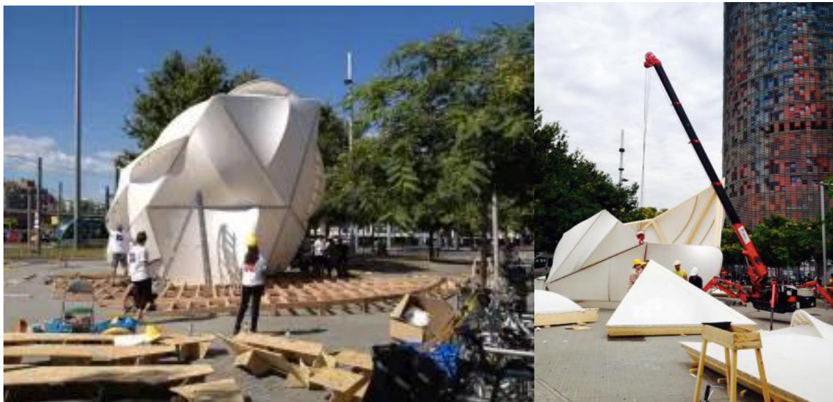
Construction de la Endesa World Fab Consenser

Mais, à la différence des smart cities où la production des données reste largement centralisée par quelques opérateurs urbains, la Fab City et son kit Smart Citizen, permettent aux citoyens de produire eux-mêmes la connaissance et les données sur la ville. Les connexions des logements privés deviennent les supports de la construction d'un outil d'intérêt général. On mesure ici toute la portée de ce dispositif de vigilance collective et d'analyse par le bas de l'état d'une ville.