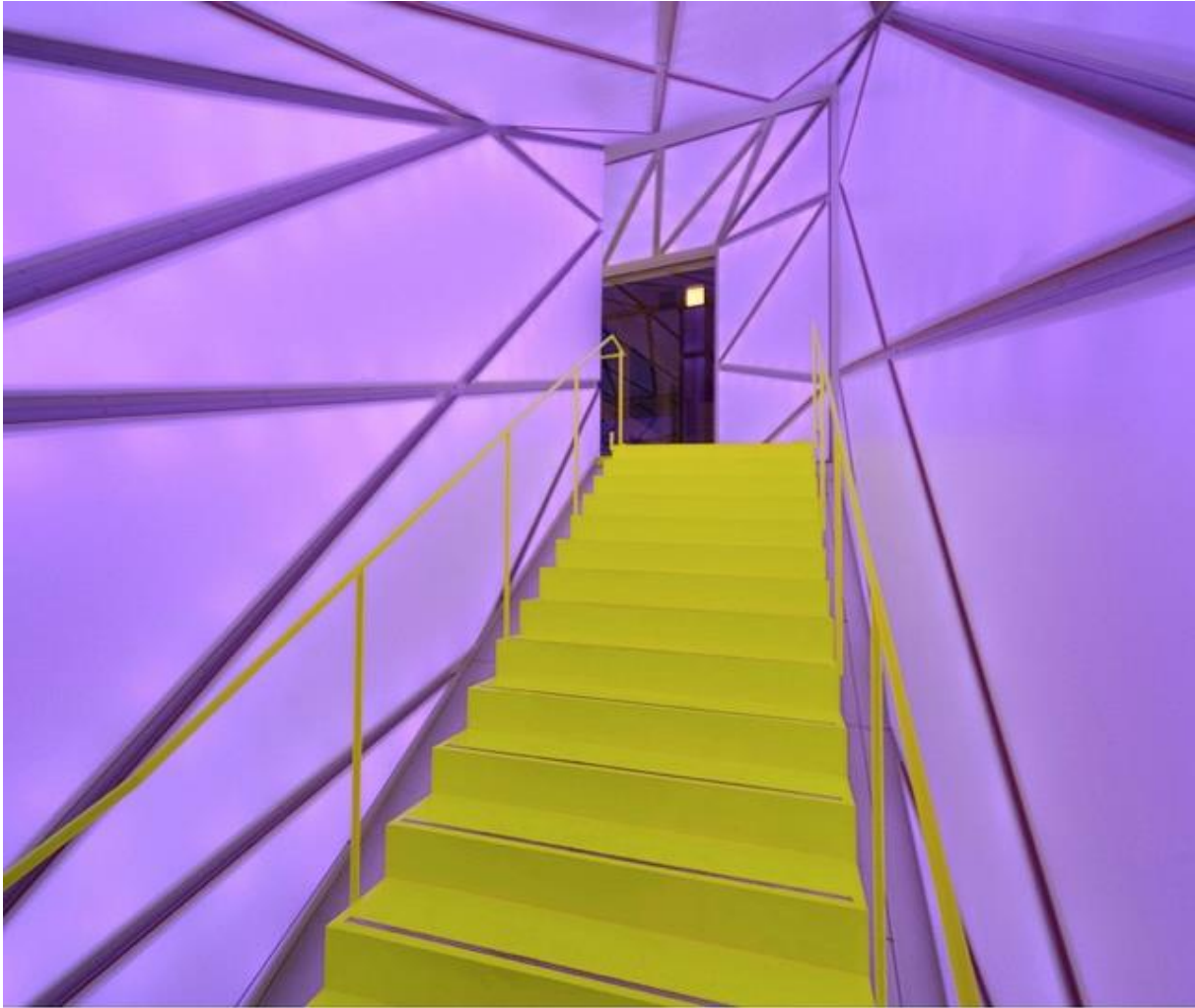
Le Media Lab Prado, Madrid