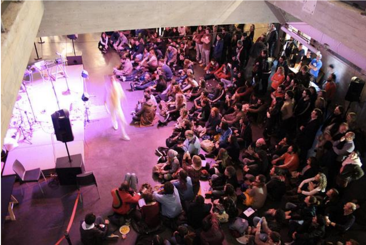
Concert de Hyperpotamus au MediaLab Prado, à Madrid