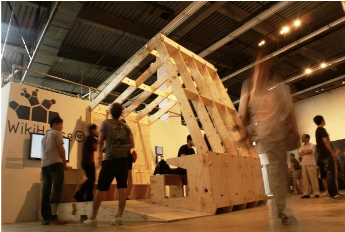
Le programme d'auto-construction libre et gratuit WikiHouse