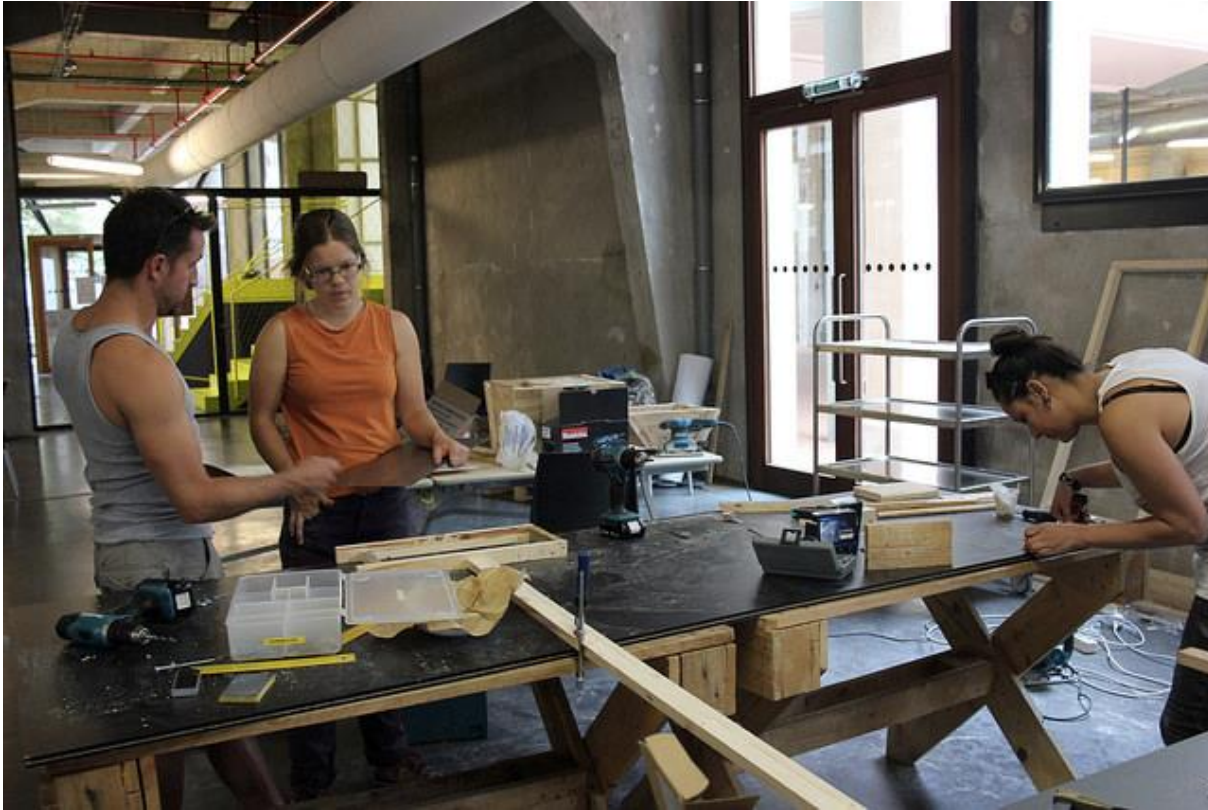
Atelier de production collaborative sur l'apiculture, Media Lab Prado, Madrid