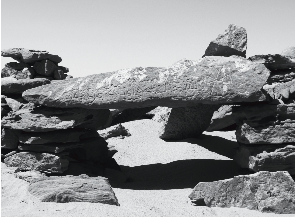
Figure 2 - L'inscription de Kilwa.