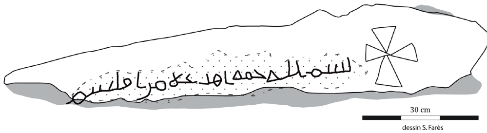
Figure 3 - Fac-similé de l'inscription.