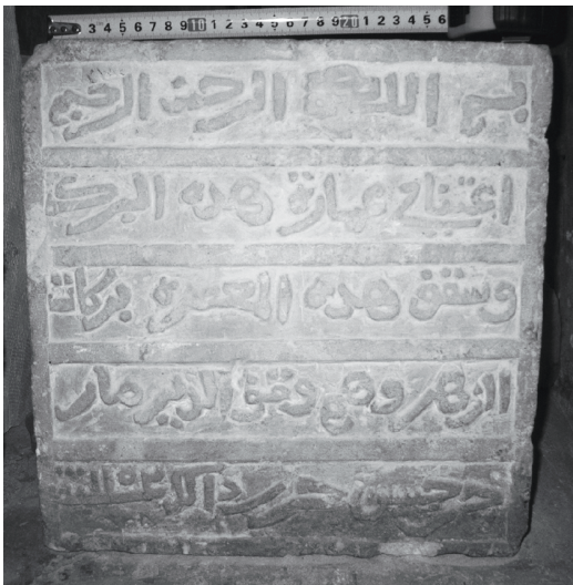
Figure 4 - Inscription arabe de Şadad (S. Farès).

La basmalah peut induire un doute sur la confession de l'auteur du texte : compte tenu du contexte chrétien toutefois, elle est sans équivoque. Elle ne suit pas la formule habituelle complète : au nom de dieu le clément le miséricordieux . Celle-ci est connue par un graffiti chrétien daté de 481 de l'hégire / 1058 de l'ère chrétienne, qui se trouve dans le couvent de Mar Moussa, près du Nabk, en Syrie. Selon un prêtre de ce couvent, elle apparaît également dans des manuscrits syriaques de l'époque antérieure à l'islam 10 . Une autre inscription chrétienne commence également par la basmalah : à Şadad, à 60 km à l'est de Homs, en Syrie, datée de 1153 de l'ère chrétienne (figure 4) 11 .