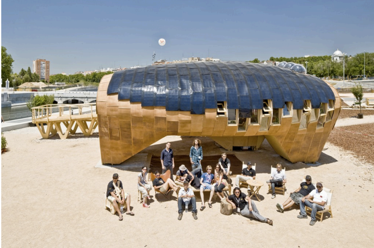
Image 3. La Fab Lab House de Barcelone. Une icône de l'éco-construction et des possibilités offertes par les techniques de fabrication digitale