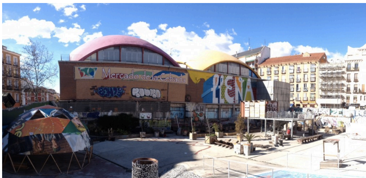
Image 2. Le Campo de La Cebada. Un centre de créativité au cœur de Madrid et autogéré par les habitants du quartier de La Latina.

Un autre Laboratoire citoyen réputé est le Campo de la Cebada. Il est situé au centre de Madrid, près de la Plaza Mayor, sur un espace de plus de 5000 m 2 . Ce lieu accueillait auparavant une piscine municipale, qui a été démolie en 2009 pour la remplacer par un grand complexe commercial. Mais la crise économique a laissé la place à un gigantesque terrain vague, réapproprié par les habitants en septembre 2010, lors des « nuits blanches » madrilènes. A cette occasion, le collectif EXYZT proposa le projet « Isla Ciudad » : la construction d'une piscine éphémère, entièrement réalisée en bois. Cette première expérience permet à des collectifs d'artistes et d'habitants de prendre conscience de l'intérêt de se réapproprier cet espace pour inventer de nouveaux usages. En février 2011, la mairie de Madrid accepte de céder temporairement l'usage du lieu à des associations du quartier, organisées au sein du collectif « la FRAVM » (Federación Regional de Asociaciones de Vecinos de Madrid 8 ). L'espace est définitivement ouvert aux habitants lors de la fête de San Isidro le 15 mai 2011.