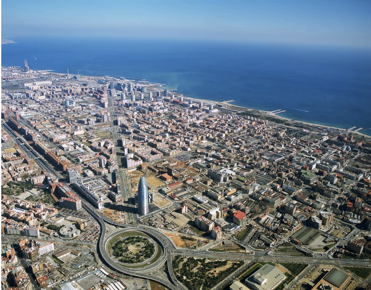
Image 1. Le modèle barcelonais

Si la capacité d'attraction des activités innovantes de Poblenou a été unanimement reconnue, un certain nombre d'auteurs émettent néanmoins quelques réserves et déconstruisent le paravent esthétique de ce quartier créatif. A l'instar d'Horacio Capel et Antònia Casellas qui soulignent les difficultés du modèle à s'ancrer dans les problématiques locales, et à assurer une planification fondée sur une vision partagée de l'aire métropolitaine (Capel 2005 ; Casellas 2006). D'autres critiquent le caractère élitiste des emplois offerts par 22@, qui s'adressent principalement à des cadres, ingénieurs et designers de haut niveau et souvent à des candidats venus d'ailleurs. Selon Montse Charle, l'un des responsables de 22@ , les trois-quarts des emplois induits par le projet sont directement liés aux activités @ (Charle, 2011). Quant aux programmes de formation et de diffusion des innovations au tissu socio-économique local (22@CreaTalent, Barcelona Centro de