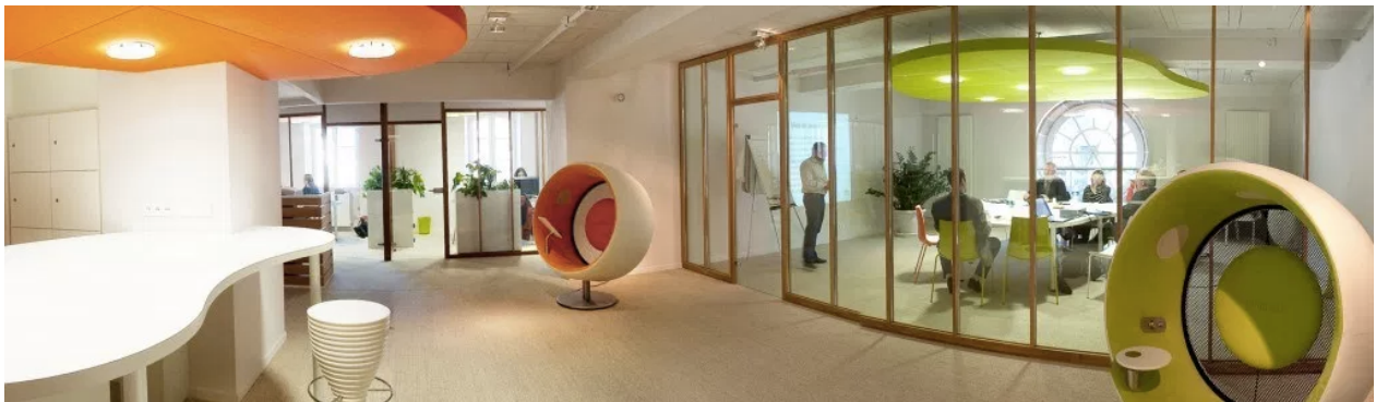
La Cocotte numérique. Tiers Lieu de la Communauté de communes du Pays de Murat dans le Cantal.

le lien social et permettre le retour d'une hyperproximité. La Creuse est une terre de résistance à la hiérarchie et le principe pair-à-pair des Tiers Lieux est totalement fidèle à l'esprit creusois » (12). Les Tiers Lieux creusois incarnent une stratégie fédératrice de long terme (régénération des centres-bourgs et lien social), ancrant ainsi dans la durée et le territoire une dynamique collective ambitieuse.