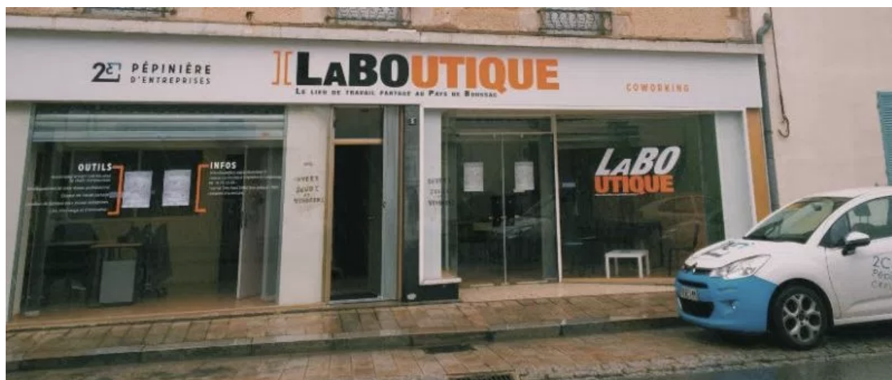
La Boutique, Espace de coworking de la Communauté de communes du Pays de Boussac (Creuse)

Ces Tiers Lieux ruraux présentent un certain nombre de spécificités. Ils se développent souvent au regard d'un enjeu de développement durable. Il s'agit de diminuer les déplacements domicile-travail, et par là même, de réduire les émissions de CO 2 et d'augmenter la qualité de vie des indépendants et des salariés. De nombreuses études ont en effet démontré l'impact des Tiers Lieux sur la réduction des consommations d'énergie et des émissions de gaz à effet de serre, mais aussi sur la performance des entreprises et le bien être des salariés (ADEME, 2014 ; DATAR, 2014 ; Caisse des Dépôts et Consignations, 2014). Un second enjeu des Tiers Lieux ruraux est de retenir, voire attirer des télétravailleurs, des néo- ruraux ou de jeunes pousses des filières innovantes. Pour cela, ces Tiers Lieux ne se limitent pas à la fonction entrepreneuriale des espaces de coworking, mais agrègent un ensemble d'aménités et de services mutualisés : connexions très haut débit, centres de ressources et de formation, pépinières d'entreprises, médiathèques, plateaux de création artistique, services publics, espaces café, etc.