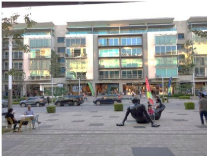
Figura 4 Vista de avenida Escazú, mini ciudad costarricense

(Con un estilo arquitectónico contemporáneo, opuesto al caso guatemalteco). Fuente: acervo de la autora, abril 2017.