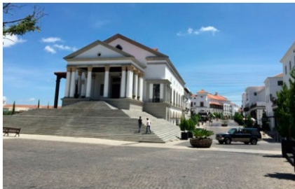
Figura 3 Vista de ciudad Cayalá combinando ciudades antiguas

ciudad como tal, no solo en cada espacio comercial o de restauración. Para tal efecto, la arquitectura de ciudad Cayalá (figura 3) fue planificada intencionalmente para evocar el encanto y nostalgia de diversas ciudades, no solo la colonial.