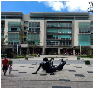
Figura 6 Estilos contrastantes

urbanos se han formado y reformado siempre siguiendo una metamorfosis parcial e incompleta y las mini ciudades son un ejemplo tangible y visible de estas reestructuraciones. Según Soja (2000) en los últimos 30 años las metrópolis modernas han pasado por un proceso selectivo de deconstrucción y reconstitución. Él cita a Iain Chambers y comenta que las postmetropolis emergentes tienen características, tanto de un nuevo estilo de vida contemporáneo, como de continuidades de un pasado. Esto lo vemos ejemplificado en ciudad Cayalá, tematizada al estilo colonial lujoso, y en avenida Escazú con una arquitectura contemporánea que apela a un estilo de vida futurista y cosmopolita (Figura 6).