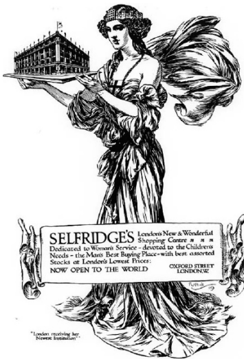
Figura 2 Ejemplo de publicidad de la tienda Selfridge’s, en Londres a principios del siglo XX.