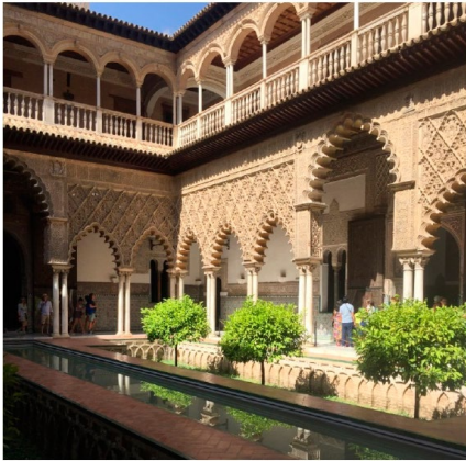
Figura 5 Jardines islámicos, Sevilla, España