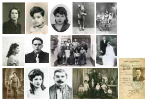
Couverture, de haut en bas et de gauche à droite :