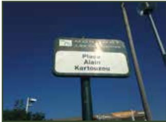
Place Alain Kartouzou à Montigny-lès-Cormeilles (Val-d'Oise). Le nom de la place a été attribué « en hommage à ce jeune Ignymontain déporté et mort à Auschwitz à l'âge de 5 ans, le 2 avril 1944 ».

Afin de rendre hommage au jeune enfant, la municipalité de Montigny-lès-Cormeilles a attribué à l'une des places de la ville, le nom d'"Alain Kartouzou". En outre, une plaque commémorative rappelle précisément, son jeune âge ainsi que la date de sa déportation à Auschwitz.