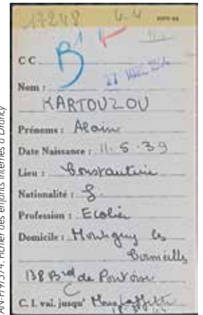
AN-F/9/574. Fichier des enfants internés à Drancy