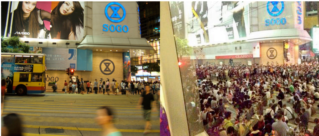
4. À gauche le Sogo Crossing, un « Shibuya Crossing » hongkongais (Rouiaï N., 2008) / à droite le Sogo Crossing occupé par les manifestants en septembre 2014 (Chow V., 2014)

l'avantage de ne nécessiter aucune connexion cellulaire ou internet pour fonctionner. Le 28 septembre, FireChat enregistre la création de 100 000 nouveaux comptes à Hong Kong. Ce même jour, le quartier de Causeway Bay et notamment le croisement entre Yee Wo Street et Hennessy Road, est investi. Le « Sogo Crossing », croisement emblématique faisant partie des images d'Épinal de Hong Kong devient un lieu de sitting . En bloquant ce croisement, les manifestants font non seulement totalement cesser le trafic sur Hennessy Road – artère principale du nord de Hong Kong Island –, mais ils immobilisent également un quartier dédié au commerce de luxe, emblématique d'un capitalisme de surconsommation. Rappelons que le mouvement initial de contestation à Hong Kong, « Occupy Central with Love and Peace », s'est inspiré du mouvement contestataire « Occupy Wall Street » visant à dénoncer les abus du capitalisme financier. La critique économique-politique, bien qu'absente des revendications de cette fin de mois de septembre 2014, reste essentielle dans la mise en place du mouvement et dans le choix géographique des lieux de manifestation.