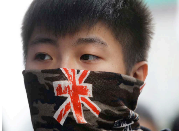
7. Jeune hongkongais arborant l'Union Flag sur son bandana lors d'une manifestation contre les marchands venus de Chine continentale, commerçant le long de la frontière sino-hongkongaise. (le 1er mars 2015).

Du côté des revendications initiales, comme cela était fortement prédictible, aucune concession n'a été consentie par le Gouvernement chinois. En juin 2015, le projet électoral soutenu par Pékin n'a pas obtenu un nombre suffisant de votes au Parlement du fait du rejet massif du texte par les députés pro-démocratie. C'est donc le statu quo ante qui prévaut : le chef de l'exécutif hongkongais restera choisi par une commission pro-chinoise, les Hongkongais ne se prononceront pas durant les élections de 2017. Ce scénario était attendu : pour Pékin, renoncer au contrôle politique sur Hong Kong aurait ouvert la porte entre autres aux revendications autonomistes dans le Grand Ouest chinois (Tibet et Xinjiang). Une perspective inacceptable. Si bien qu'aujourd'hui, le flux des automobiles a réinvesti les artères de Hong Kong. Les parapluies se sont fermés. Le paysage urbain ne porte presque plus aucun stigmate de ces manifestations sans précédent.