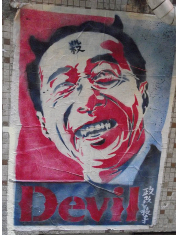
1. Affiche placardée dans les Mid Levels (Central) représentant Henry Tang, Secrétaire général des finances de 2003 à 2007 et Chef de l'exécutif par intérim en 2005, éclaboussé par un scandale politico-financier en pleine course pour l'élection du Chef de l'exécutif en 2012