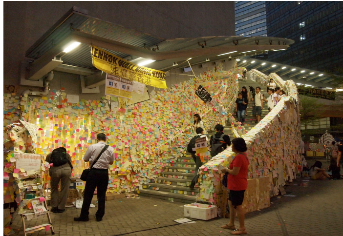
8. Le Lennon Wall, Hong Kong

Aujourd'hui, seuls quelques tags, graffitis et dessins restent présents, de manière éparse et temporaire sur les façades de la ville. Dans les Mid Levels, au cœur du quartier de Central, ces derniers parapluies ouverts, dessinés à l'aérosol sur les murs, rappellent les aspirations et les craintes des Hongkongais plongés dans un système politique presque schizophrène. Alors que Britanniques et Chinois ont seulement organisé un régime d'exception jusqu'en 2046, alors que cette année sera la dernière au sein de laquelle Hong Kong bénéficiera d'une relative autonomie politique et économique, le Hong Kong présent est déjà presque un Hong Kong du passé : ce Hong Kong de la transition et de l'incertitude, condamné à disparaître d'une mort annoncée.