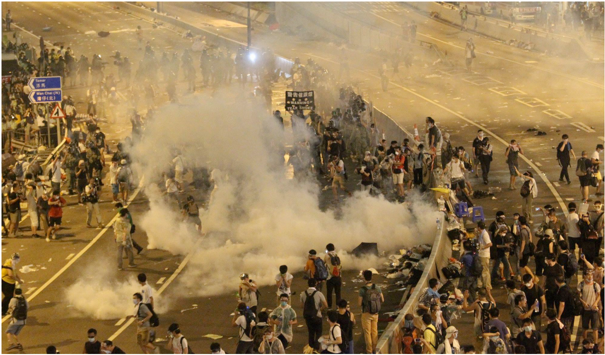
2. Manifestants sous une pluie de gaz lacrymogène (Cheng K.Y. 28 septembre 2014)