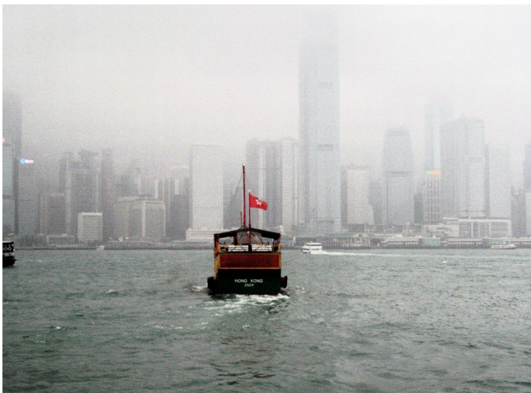
Couverture : Hong Kong (Rouiaï, mars 2013)