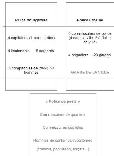
Illustration 2 : Schéma de la police pendant la peste

Les différents corps de police marseillais pendant la peste (1720-1722). En noir, l'organisation de la police en temps ordinaire ; en rouge, les modifications de cette organisation effectuées pendant la peste. © F. Beauvieux