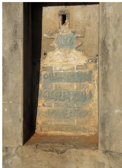
Épitaphe la tombe du sultan Ahmad bin Fumoluti

de l'Est : l'ivoire et les esclaves. Son installation définitive à Zanzibar accélère la migration de nombreux autres marchands dans son sillage sur la côte est-africaine 16 . Dans le nord de la côte swahili, ce sont surtout des marchands et religieux hadrami qui s'installent. Ces migrants arabes vont être à l'origine d'un processus d'arabisation du littoral est-africain 17 .