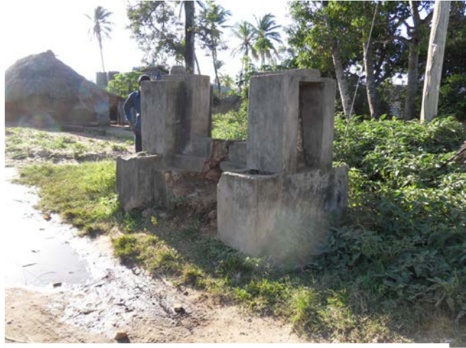
La tombe du sultan de Witu dans le mtaa de Diwani

L'histoire de ce sultanat est au cœur des enjeux de l'ensemble de la côte swahili au XIXe siècle et permet notamment d'illustrer une des formes de résistance que les waungwana ont adoptée face à l'hégémonie économique, sociale et politique du sultanat de Zanzibar. En effet, Seyyid Said, «prince marchand» et imam d'Oman depuis 1804, déplace sa capitale à Zanzibar en 1840 dans l'intention de profiter plus directement des produits d'Afrique