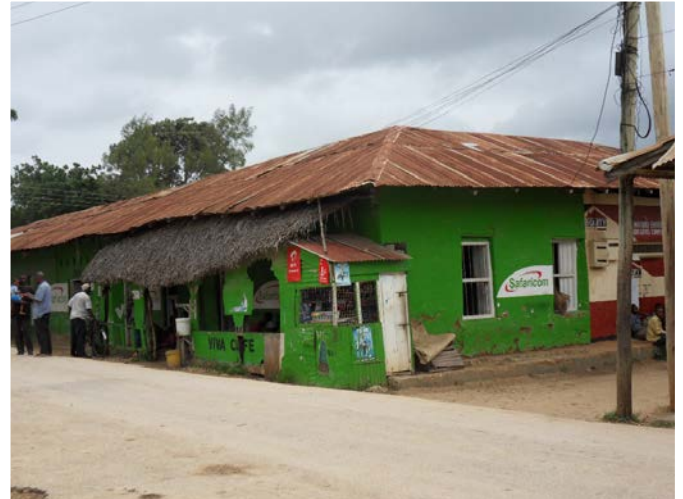
L'ancien palais du sultan à Witu

effet d'abord installés à Kau, centre depuis longtemps déjà dans l'orbite commerciale de Pate 13 et qui conserve un débouché sur l'océan, avant de partir pour Witu ; mais les raisons de ce départ restent obscures.