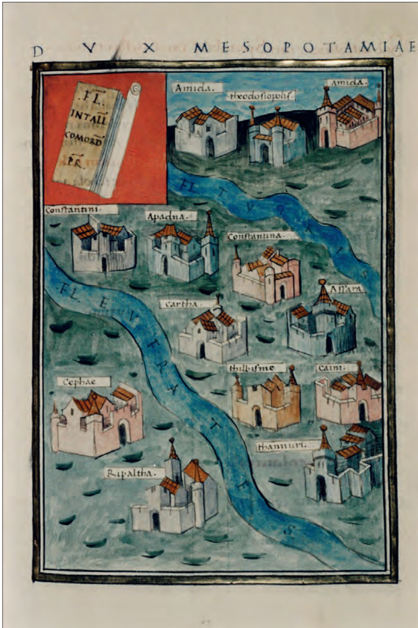
Canon. Misc. 378, Bodleian Library, f. 122r et 123r (en ligne sur http://www.bodleian.ox.ac.uk/bodley ).