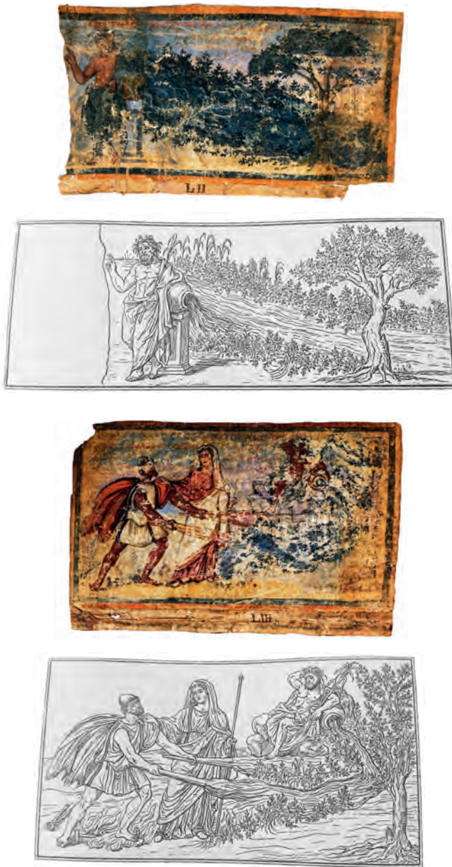
Fig. 2a-b. Le Scamandre dans l' Iliad Ambrosiana LII-LIII, d'après Ranuccio Bianchi Bandinelli, Hellenistic-Byzantine Miniatures of the Iliad (Iliad Ambrosiana) , Urs Graf-Verlag, Olten-Switzerland, 1955, p. 80, fig. 88-89.