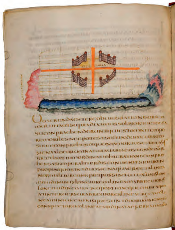
Fig. 4. Le fleuve comme limite dans le Corpus Agrimensorum . Guelf.36.23A, fol. 49v (Codex Arcerianus, VI e siècle apr. J.-C., en ligne http://diglib.hab.de/mss/36-23-aug-2f/min/00160.jpg ), publié dans C. Thulin, Corpus Agrimensorum Romanorum I.1 Opuscula Agrimensorum Veterum , Leipzig, Teubner, 1913, fig. 97.