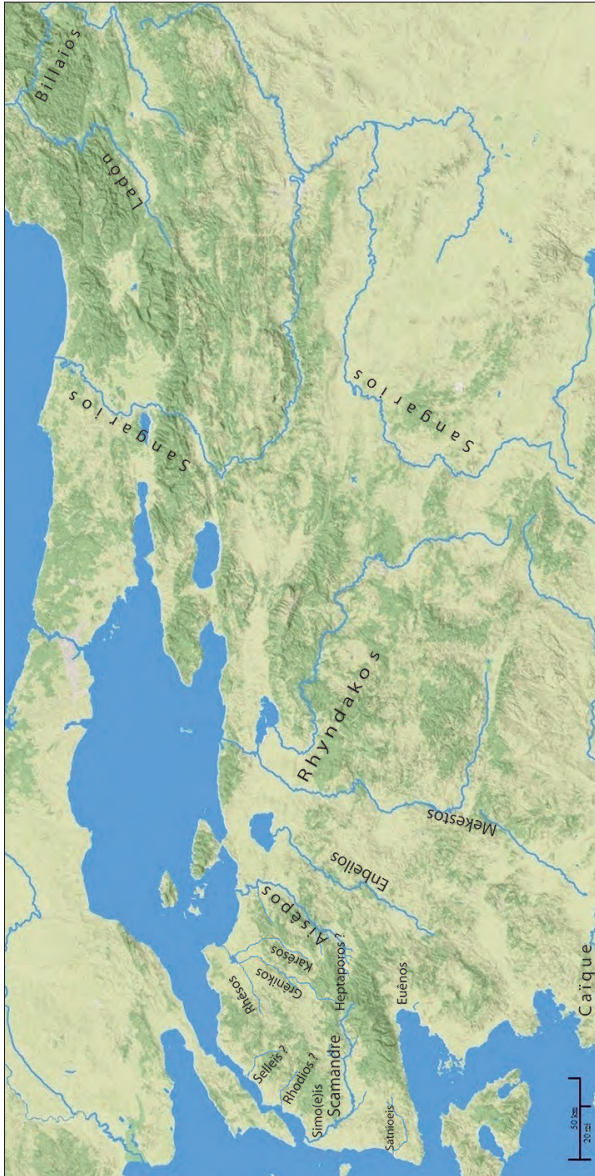
Fig. 7. Proposition d'identification des fleuves homériques et hésiodiques de la Troade.