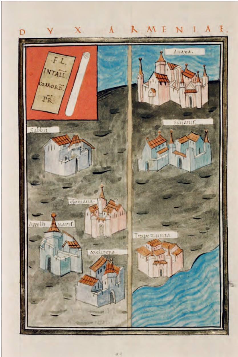
Fig. 5a-b. L'Euphrate vu sur les représentations de l'Arménie et de la Mésopotamie dans Notitia Dignitatum (reproduction de 1436 d'après un original tardo-antique) : MS.