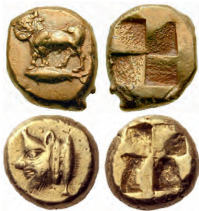
Fig. 1a-b. Dieu-fleuve grec, dont le visage combine des traits humains et taurins, sur deux monnaies en électrum de Cyzique, dans la première moitié du V e siècle av. J.-C. Cf. H.P. ISLER, « Acheloos », LIMC , 1.1, 1981, p. 12-36 (p. 14, n° 20-21).