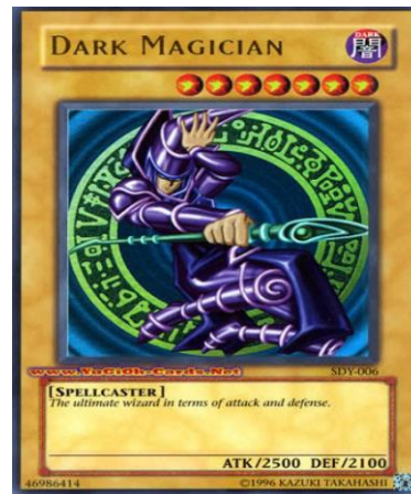
Figura 1: Cartas Monstruo de la baraja Yu-Gi-Oh

El juego inicia con una baraja de 40 cartas de diferentes clases y efectos, las cuales tienen una imagen que la representa junto a su respectivo efecto, los mismos generan diferentes interacciones entre las cartas de la baraja. Hay tres (3) tipos de cartas principales que juntas otorgan la victoria sobre el oponente: monstruo, mágicas y trampas.