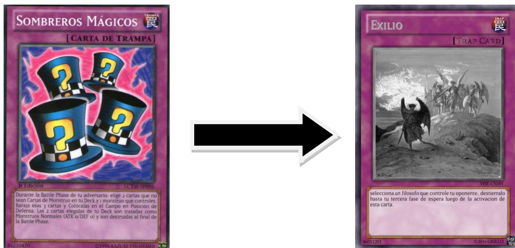
Figura 7: Ejemplo de adaptación de una carta Trampa Yu-Gi-Oh a una acción del juego

los del oponente. Estas no tendrán tanta relación con los monstruos pero sí más con el juego al ofrecer acciones genéricas no estrechamente relacionadas con conceptos filosóficos sino para darle velocidad e interactividad al juego. 3