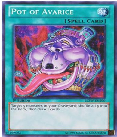
Figura 2: Cartas Mágicas de la baraja Yu-Gi-Oh

Las cartas mágicas son el apoyo de las cartas de monstruo, éstas siempre representan una acción de beneficio para el jugador, el cual está determinado por su efecto.