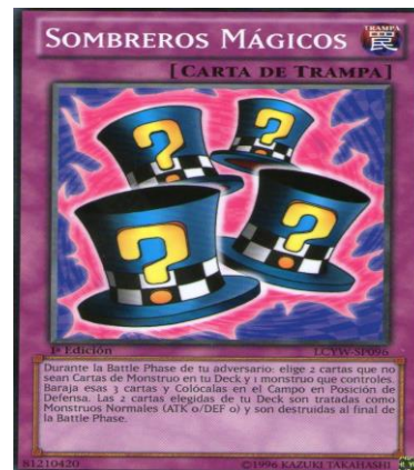
Figura 3: Cartas Trampa de la baraja Yu-Gi-Oh

Las cartas trampa, al igual que las mágicas, representan acciones, pero esta vez negativas para el adversario, actúan como la protección para los monstruos.