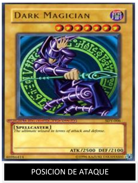
Figura 4: Posición de ataque y defensa de la baraja Yu-Gi-Oh

manera de replanteamiento, si no se invocaron monstruos en la fase principal 1 puede hacerse pero no puede realizar ataques, también se pueden usar las cartas mágicas y de trampa que se tengan disponibles—, Fase final –declara el final del turno y cede el juego al otro jugador.