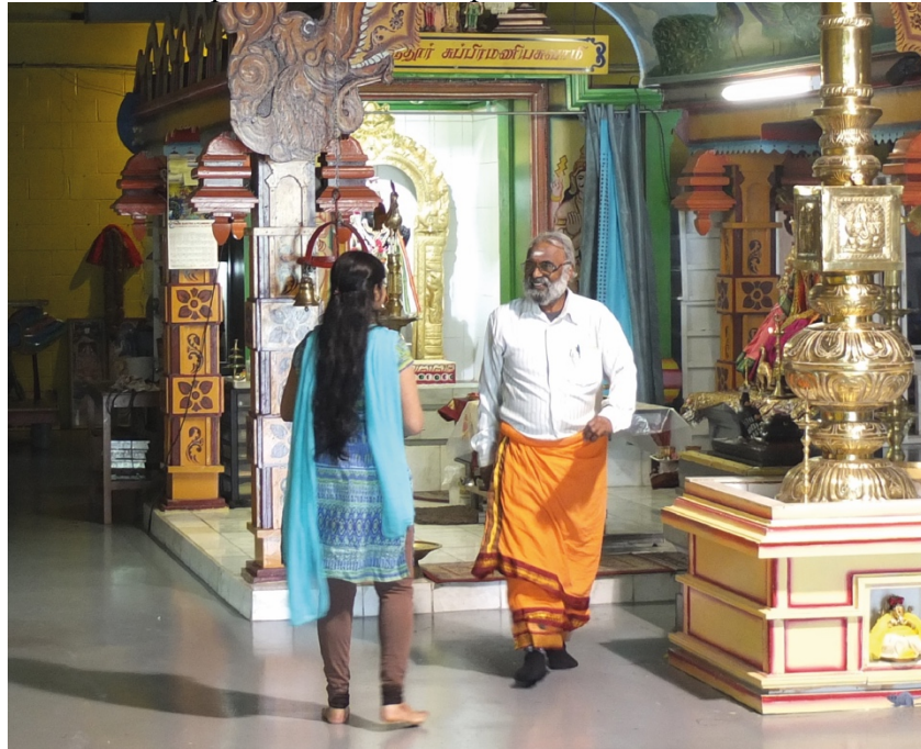
Figure 3. Déambulation et rencontre entre une fidèle et le responsable d'un temple hindou à Toronto

la société locale (Appadurai et Breckenridge, 1976) et ce aussi bien en Inde et à Sri Lanka qu'en diaspora. Pour autant, les motivations socialisantes des déambulations dans le temple peuvent être bien plus légères, comme ce fut par exemple le cas lorsque deux jeunes hommes interrogés un dimanche dans un sanctuaire du sud de l'Inde nous ont avoué s'y être rendus essentiellement pour y rencontrer du monde et y voir des jeunes femmes. Cette recherche de sociabilité et d'un entre-soi est une motivation particulièrement forte en situation de diaspora, où les temples sont souvent les principaux lieux de rassemblement communautaire. A Maurice par exemple, la jeunesse tamoule se retrouve régulièrement dans les temples lors des grandes fêtes du calendrier religieux, telles que govinden ( kōvintan ) ou cavadee ( kāvāṭi ), sans nécessairement prendre part activement aux rites (fig. 3).