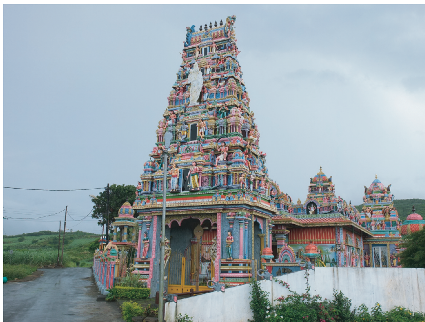
Figure 4. Grand temple de plantation rénové à Maurice

Il ne faut donc pas perdre de vue que la nature, l'ancrage et la visibilité de ces lieux de culte produits par la mobilité migratoire dépendent aussi de ce qui est en jeu dans le champ politique et social local du pays d'installation. D'ailleurs, à Maurice, le financement de ces constructions et agrandissements se fait également sur une base locale, sans lien avec le pays d'origine ou la diaspora, contrairement au recrutement des prêtres et des artisans.