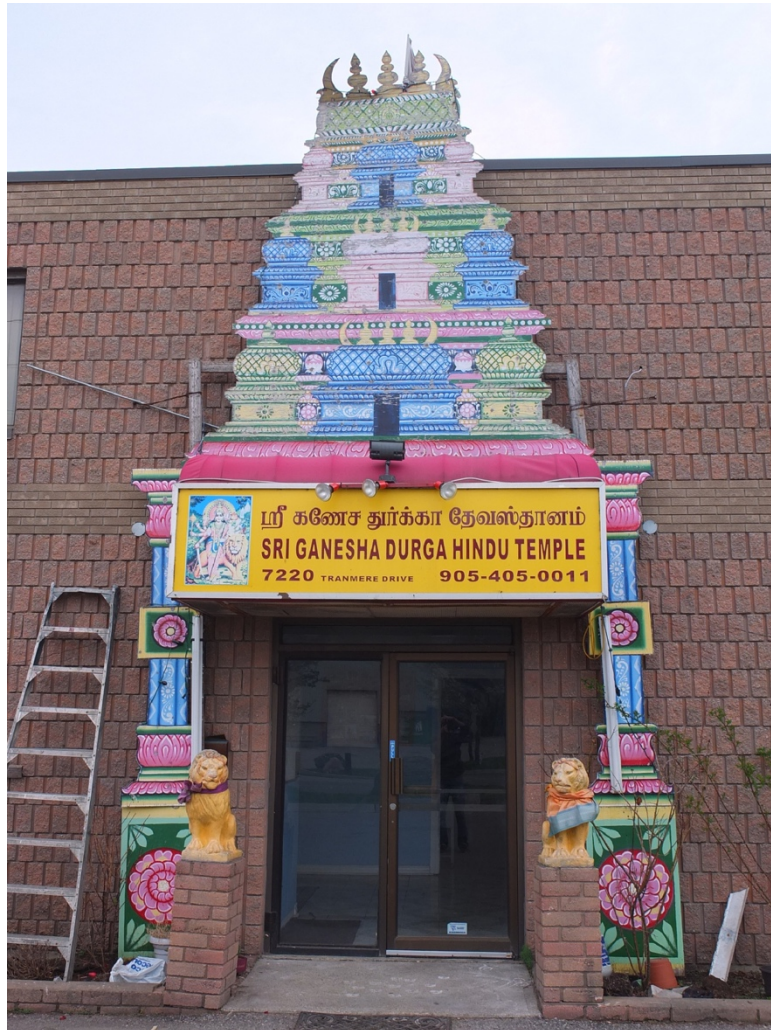
Figure 5. Temple « mobile » à Toronto